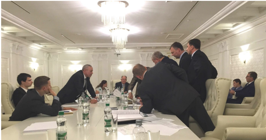
Сьоме засідання робочої групи з питань безпеки, 5 серпня 2015 р.