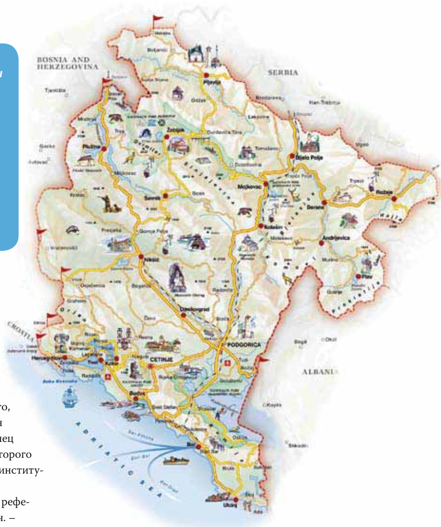
Пользующееся заслуженной славой морское побережье Черногории протянулось на 293 км. Страна имеет общую границу с Боснией и Герцеговиной, Сербией, Албанией, Хорватией и Италией – через Адриатическое море. Карта предоставлена Туристическим центром Черногории.

Автором этого специального материала по Черногории является Сюзанна Лёф, сотрудник по работе с прессой Отдела прессы и общественной информации Секретариата.