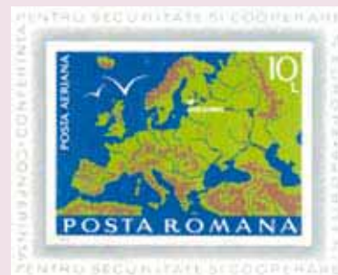
Румынская марка, выпущенная при участии посла Бадеску в 1975 году в ознаменование факта подписания хельсинкского Заключительного акта. Через три десятилетия независимая Черногория подписала в Хельсинки тот же исторический документ.

“Я очень горжусь достижениями ОБСЕ в этой стране за последние пять лет, но я также понимаю, что еще многое предстоит сделать, и впереди у нас еще немалые проблемы”, – сказала она в заключение.