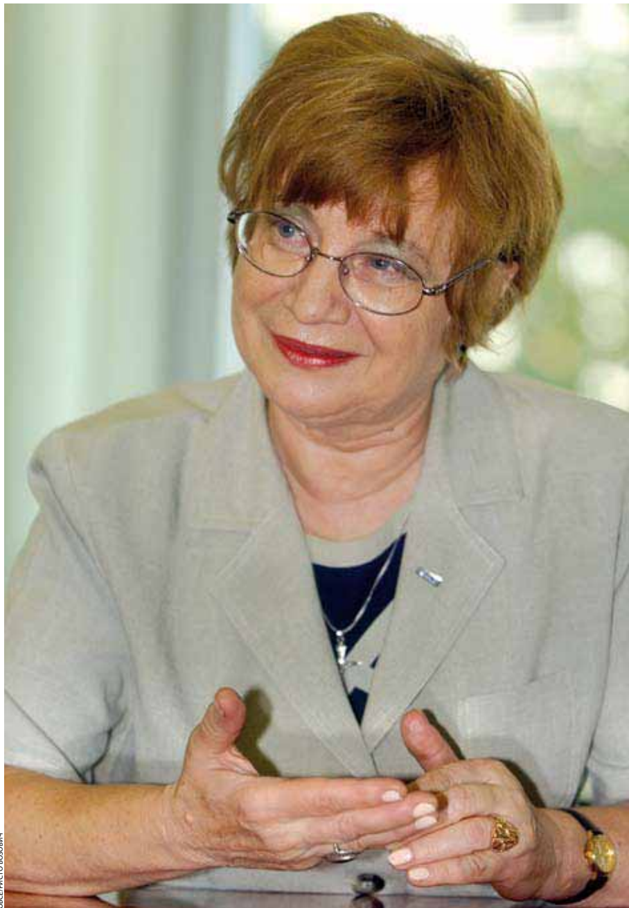
Посол Параскива Бадеску

К счастью, Миссии не приходится заниматься