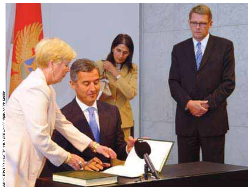
МИНИСТЕРСТВО ИНОСТРАННЫХ ДЕЛ ФИНЛЯНДИИ/ХАРРИ КИЛПИ