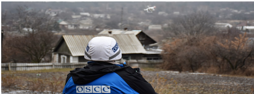
Спостерігач СММ керує БПЛА в Авдіївці, Донецька область