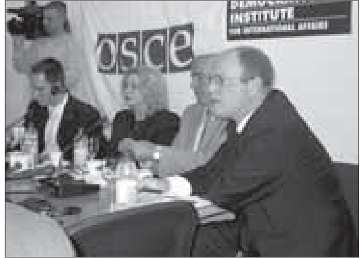
26 Mayıs'ta yayınlanan Kamu Toplantıları El kitabı hakkındaki basın konferansı

tasarıları görüşülürken iyi bir eğitim görmüş olan yasa tasarısı uzmanının yokluğu sezilmektedir. Personel yetersizliği yanı sıra, Komisyon Başkanlarına ait olan daireler olduğu gibi toplantı salonları yetersizliği sorunlar arasına yer almaktadır. 6. Komisyon çalışmalarına özel olan Prosedürler Kuralları yoktur. Komisyon başkanlarının çoğu genel kurul prosedürler kuralları görüşlerini Komisyon sürecine göre uyarlamaktadırlar. Demek oluyor ki, bu prosedürler bir komisyondan diğer komisyona değişmektedir. 7. Tercüme hala yasama sürecini yavaşlatan bir faktör olmaya devam etmektedir. Her yasanın "resmi" şekli İngilizce olmakta ki bu düzensizliğe neden olabilir. "Resmi" şekil ile Arnavut ile Sırp dilleri arasındaki ince farklar yasa tasarısının gerçek etkileri konusunda anlaşmazlıklara neden olabilir. 8. Parlamento grupları hala yöneticileri tarafından yasamada gruplara nasıl bir yerin verildiği konusunda her zaman