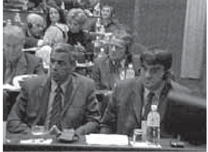
2003 yılının Eylül ayında düzenlenen Genel Kurul Toplantısında Meclis'in Geri Dönüş Koalisyonu üyeleri

Kosova Sırlarından oluşan GÖE temsilcilerinin bu memnuniyetsizliği 2004 yılının Şubat ayında onarımdan geçen Kosova Meclisi holünün açılışında zirveye ulaşmıştı. Kosova Meclisi'nin yenileştirilmiş olan holünün duvarlarını Arnavut tarihi resimleri süslemekteydi. Sırp ya da diğer bir topluluk tarihini ve geleneğini dile getiren hiçbir esere yer verilmemişti. GDK, Meclis toplantılarını boykot etmeye karar vererek, Meclisin çeşitli ek organlarında, komisyon ve çalışma gruplarında çalışmaya devam etti. Mart ayın şiddet olayları bu zor döneme rastladı ve bunun sonucu olarak GDK, bütünlüklü olarak tüm enstitüleri boykot etmeye başladı. Kosova Sırları ile GÖE arasındaki bu narin bağlar, olaylar esnasında evlerin ateşe verilmesiyle devam etti. Buna ek olarak, çatışmaların Kosova Sırlarının çoğu için Kosova enstitülerine katılmanın faydası olmadığı, trajediyi önlemek ve durdurmak için yeterli olmadığına bir deliliydi. Mart'ta olagelen kriz