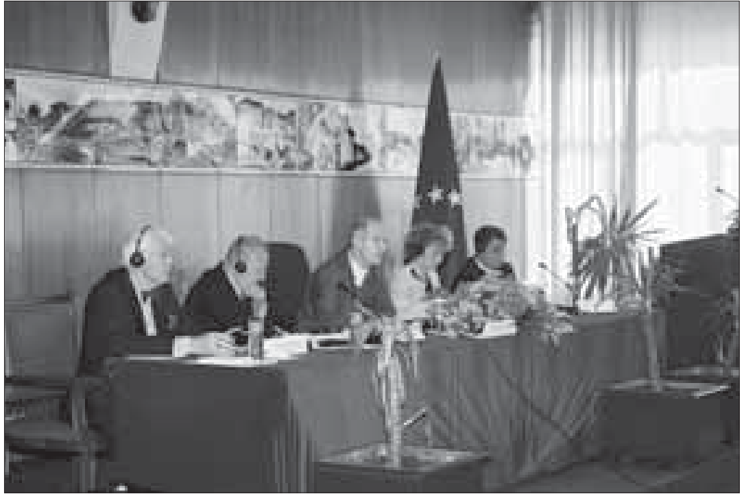
24 Haziran 2004 düzenlenen AIA Forumu

Demokrasilerin hüküm sürdüğü parlamentolara kıyasla Kosova Parlamentosu üyelerine daha büyük bir sorumluluk düşmektedir. Kosova Meclis üyeleri demokrasinin piyонерleri gibi