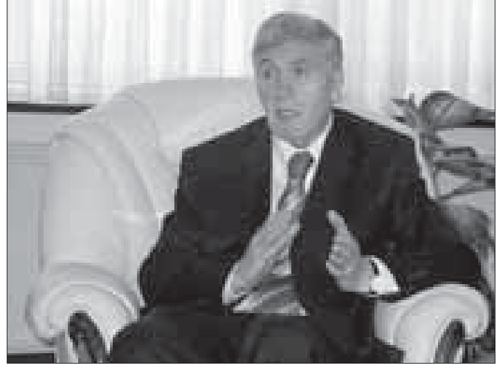
Kosova Meclis Başkanı Prof. Nexhat Daci

Düşünceme göre GSÖT çok çalıştı. Dürüst bir adamdı. Kendisinin çok ciddi bir siyasetçi olduğuna tanık oldum ama UNMIK öyle bir şekilde yapılandırılmış ki başaramaz bir durumdadır. Her zaman doğru ve dürüst olmayı sevdim. Durumun ilerletilebileceğine inanmıyorum. Holkeri ile çok sayıda toplantılarımız oldu, kendisi ile incelemelerimi