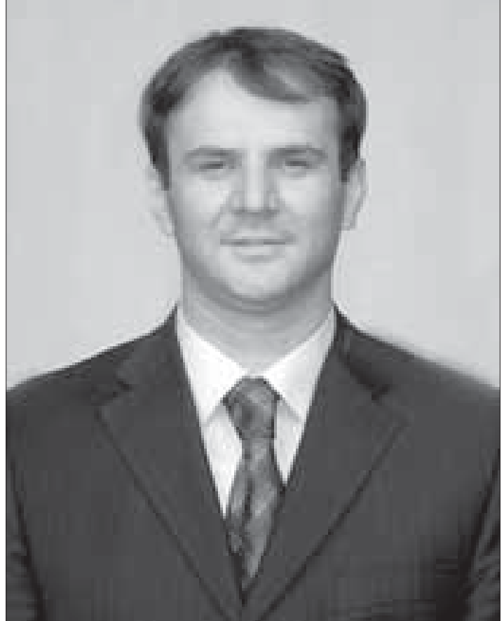
Prof. Hajredin Kuçi

Tüm bu etkinlikler çerçevesi içerisinde bir hakembilirkişi olarak uluslararası topluluğunun rolü çok önemlidir. Objektif bir değerlendirmeye göre, bu standardların gerçekleştirilmesi genelde GSÖTe bağlıdır. Uluslararası topluluğu temsilcilerinin çoğunun sadece kısa bir süre Kosova’da kaldıkları göz önünde bulundurulursa, yapılan değerlendirme nesnelere çok soyuttur. Bu konuların çok soyut görünmelerine rağmen kvantite ve kalite olduğu gibi Standardların gerçekleştirilmesinin son müddeti Kosova ve onun yurttaşları için çok önemlidir. Nihayi statüsün değerlendirilmesinde Kosovalıların çoğunluğunun bağımsızlık taraftarı olduğunu bilmek çok faydalı olacaktır. Bu, standardların gerçekleştirilmesinde enstitüleri ve yurttaşları motive edip