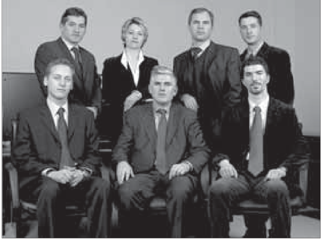
Kosova Başbakanı Bajram Rexhepi ve danışmanları

Tüm enstitülerin bu yönde çalıştıkları yadsınamaz, ayrıca ilerletilebilecek ne geliştirilebilecek çok şeyler vardır. Bireysel irtibatların örnek alınabilecek ve çok güzel çalışmaların yapıldığı