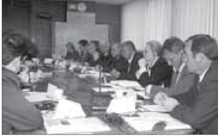
3 Haziran'da düzenlenen seminerde politik danışmanlar

3 Haziran tarihinde AGİT, Ulusal Demokratik Enstitüsü (UDE) ve Friederic-Ebert-Stiftung (FEs) tarafından ortaklaşa olarak ve "Hükümet ile Meclis'in birbirine tesiri" adlı seminerin konusu, Bakanlıklarda politik danışman olarak çalışanlar için düzenlenmişti. Bu seminer, Mayıs/Haziran 2004 tarihinde politik danışmanlar için düzenlenen daha geniş eğitimin bir devamıydı.