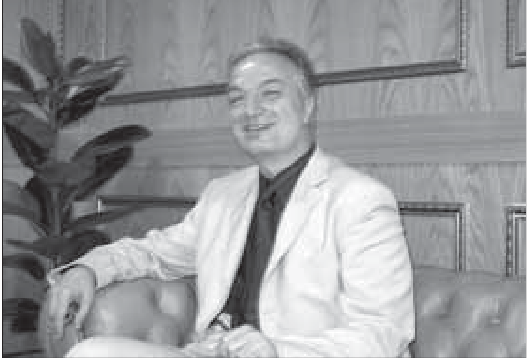
Meclis Başkanlığı üyesi Sn Xhavit Haliti

Asi: Düşüncenize göre, Meclis yıl içerisinde Standardların Gerçekleştirilmesine değin Plana ilişkin öngörülen etkinlikleri gerçekleştirebilirler mi?