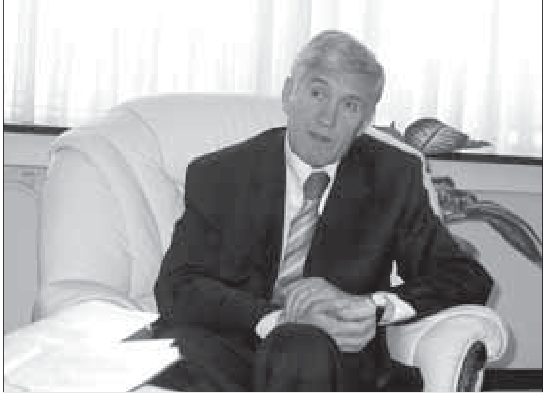
Kosova Meclis Başkanı Prof. Nexhat Daci

Bu dönem içerisinde, Meclis tarafından elde edilen en iyi sonuçlar görüşülen yasalar sayısı bakımından elde edilmiştir. Medyada etkinliklerimizin eleştirildiğini biliyorum ama bu eleştirilerin genelde, Avrupa’nın diğer parlamentolarını görmemiş ve enformasyon kaynağı olarak gazetelere dayanan kişiler tarafından gelmektedir. Avrupa ülkelerinde bir kanun tasarısının parlamento tarafından görüşülmesi için ortalama olarak üç aydan beş ay kadar zaman gerekmektedir. Bir kanunu onaylamamız için bize gereken en uzun zaman beş haftaydı. Şu anki Meclis’te, Kosova’nın kanunlara sahip olmadığı, kaliteli kanunlara sahip olmadığını göz önünde bulundurarak onaylanan kanun sayısı arasında dengenin sağlanması için çaba göstermeliyiz. Şu anki Meclis’in diğer önemli gelişmelerinden biri, en azından Martın krizli olaylarına kadar istikrarlı bir siyasi çevreyi sağlamasıydı. Parlamento genelde sıcak tartışmaların yapıldığı ve hararetin sık sık yükselmekte olduğu bir yerdir. Parlamentomuzda yedi azınlık parti grubunun bulunduğunu göz önünde bulundurarak, tartışmalar için uygun bir havayı yaratmaya çalıştım. Çok kere, Arnavutlar ile Geri Dönüş Koalisyonu Meclis üyeleri arasında ortaya çıkan gerginliği