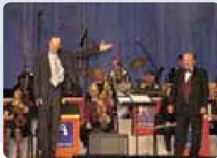
Произведения Вилли Вайнера исполняются на концерте 29 сентября, посвященном культуре терпимости.

„круглым столом“ об устранении административных препятствий и улучшении деловой атмосферы для МСП. Рекомендации, касающиеся реформы, выработанные в ходе этих обсуждений, были включены в государственную программу 2006 года развития МСП.