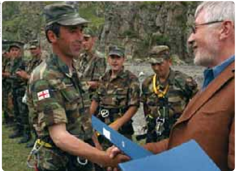
Первая группа грузинских пограничников получает удостоверение от главы Миссии посла Роя Рива. К концу года 375 слушателей получили положительную оценку о прохождении основного учебного курса в рамках Программы содействия подготовки.

всеобъемлющую систему управления кадрами, создать подразделения по работе полиции с местным населением и включить новый базовый подготовительный курс в учебную программу