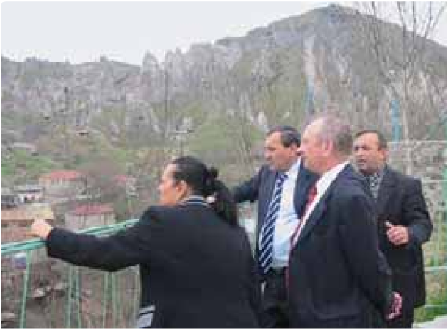
Деятельность в провинции Сюник включала в себя посещение для оценки воздействия на окружающую среду

родную конференцию, в ходе которой международные эксперты обсуждали наилучшую практику в области борьбы с коррупцией. Бюро также продолжало председательствовать в рабочей группе международных и двухсторонних миссий, заинтересованных в оказании помощи этим усилиям.