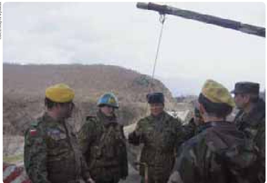
Одной из ключевых задач Миссии является мониторинг деятельности смешанных сил по поддержанию мира в зоне грузино-осетинского конфликта.

Миссия активизировала консультации с участниками СКК, высокопоставленными грузинскими должностными лицами и посольствами в целях обеспечения поддержания сторонами диалога и по-