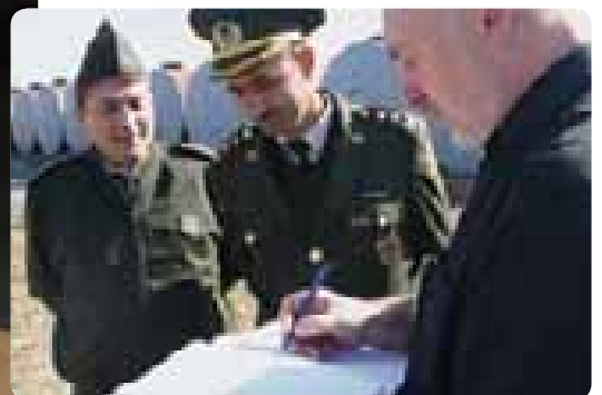
Сверху: эксперты министерства обороны дают подобную информацию объединенной команде ОБСЕ и НАМСА/НАТО в хранилище „меланжа“ в Мингечевире.