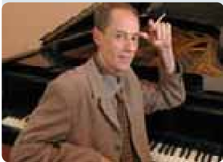
Музыка выдающегося армянского композитора Вилли Вайнера насыщена культурными традициями нескольких наций.