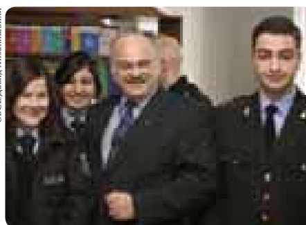
Полицейский советник Миссии с будущими курсантами грузинской полицейской академии.

полицейской академии. Миссия также оказала финансовую помощь в ремонте библиотеки академии и приобретении нового оборудования для нее.