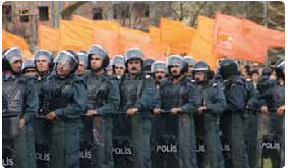
Полиция и участники предвыборной демонстрации в Баку в сентябре.

Осуществление национального плана действий по борьбе с торговлей людьми, который был принят в 2004 году, активизировалось с принятием нового закона о борьбе с торговлей людьми и поправок к уголовному кодексу. Бюро и министерство внутренних дел отремонтировало здание, ставшее первым в стране убежищем для жертв и для тех, кто сталкивается с опасностью торговли людьми.