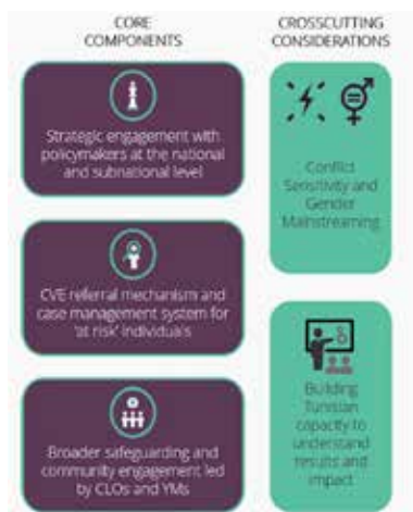
Figura 1: Modeli Jendouba

Ky program për ndërtimin e besimit komunitet-polici për t'iu kundërvënë ekstremizmit të dhunshëm filloi si projekt pilot në Jandouba dhe Tabarka, me qëllim krijimin dhe promovimin e një modeli në kontekstin tunizian për policimin në komunitet dhe për angazhimin kundër ekstremizmit të dhunshëm, bazuar në praktikatat e mira holandeze dhe praktikatat ndërkombëtare. 18 muajt e parë të programit iu kushtuan krijimit të një modeli të zbatueshëm, udhëhequr nga policia në bashkëpunim të ngushtë me qeverinë vendore dhe me burime të tjera me bazë komunitetin.