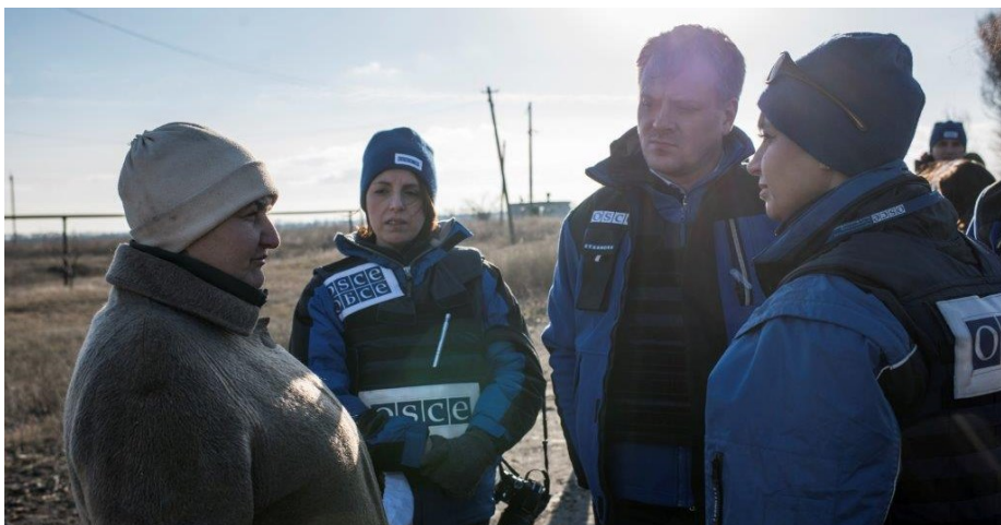
Спостерігачі СММ ОБСЄ спілкуються з місцевими жителями в східній Україні.