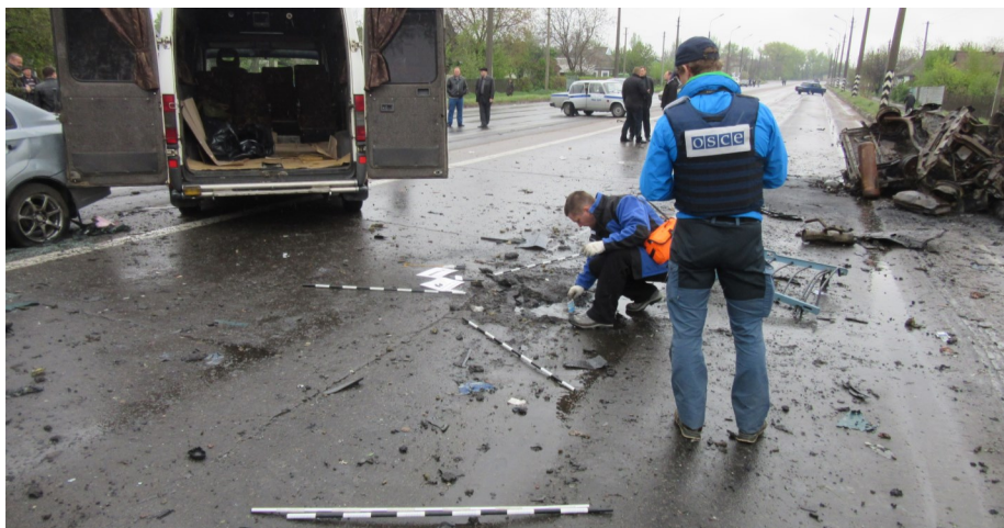
Спостерігачі СММ ОБСЄ на місці інциденту в с. Оленівка, квітень 2016 р. (ОБСЄ)