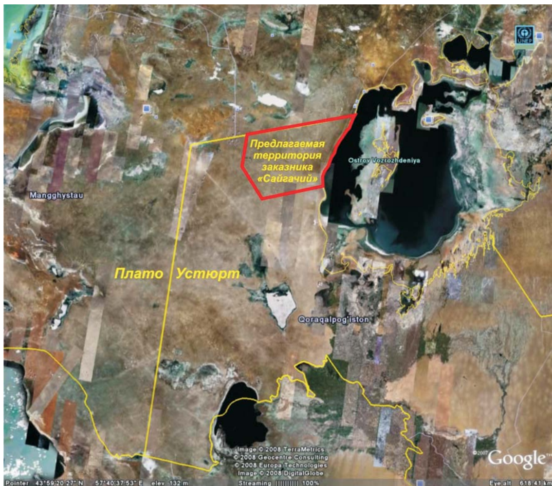
Предлагаемая схема территории заказника «Сайгачий».

Все описанное – первоначальная стадия трансформации ОПТ, существующей сегодня лишь «на бумаге», в реальный активный механизм для территориальной охраны и предпосылка для создания трансграничной системы охраняемых территорий на Устюрте, способной обеспечить эффективную охрану мест окота и миграционных путей сайгака и других представителей уникального природного и культурно-исторического комплекса плато Устюрт.