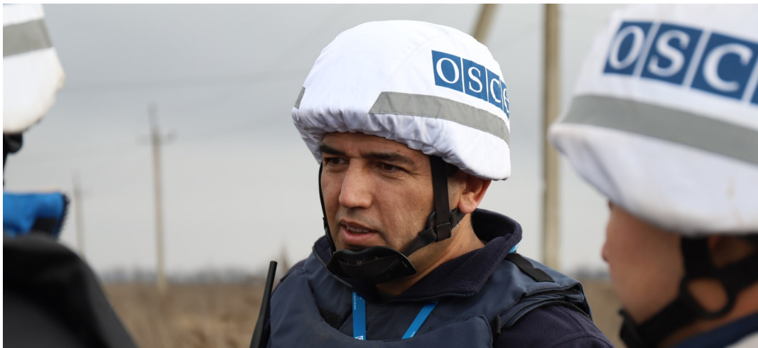
Спостерігачі СММ поблизу ділянки розведення в районі Петрівського, Донецька область