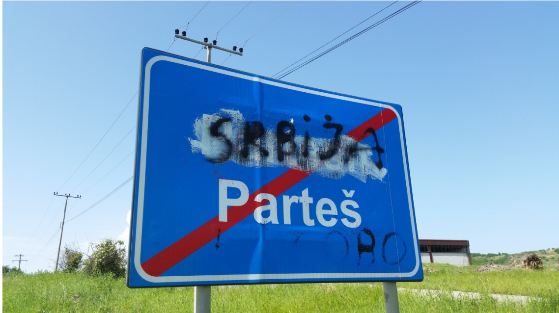
Parteš belediyesinde yol işareti, 28 Mayıs 2014

Belediye meclisi oturumlarının tercüme edilmesi konusundaki görevin yüksek derecede olması gözönünde bulundurularak , belediyelerin yarısının toplantı tutanaklarını tercüme etmemesi endişe vericidir. Ayrıca, belediyelerin yarısı tüm belediye yasal tasarılarının ve kanunlarının tüm resmi dillere tercüme etme görevini yerine getirmemekle birlikte gereken kaliteye sahip olan tercümeleri temin etmemektedirler. Belediyelerin, kamu toplantıları süresince insan ve finansi kaynakları artırarak tüm resmi evrakları gereken şekilde tercüme edilmesini temin etmeleri gerekir.