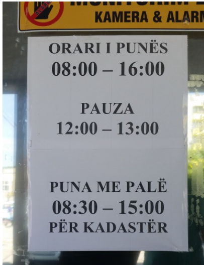
Gilan belediyesinde giriş kapısı işareti, 28 Mayıs 2014

AGİT'in yapmış olduğu sıralı gözetlemeye göre, çok dilli belediye işaretlerinin uygulanmaması pratiğinin temel nedeni politik isteksizlik ve görev anlayışının hakim olmamasından ileri gelmektedir.