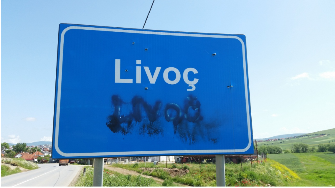
Gilan belediyesinde yol işareti, 28 Mayıs 2014