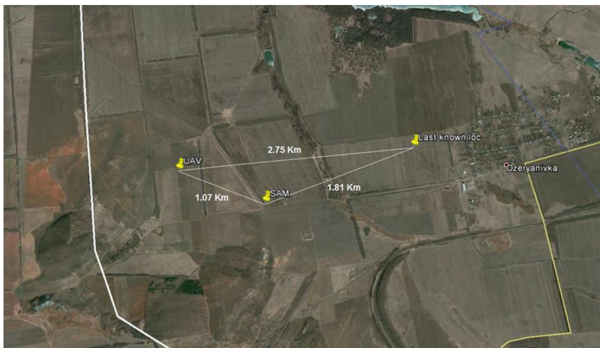
Рис. 2: На снимке указаны месторасположение БПЛА в момент, когда он зафиксировал МТ-ЛБ с установленным на нем зенитным ракетным комплексом (9К35 «Стрела-10», 120 мм), позиция МТ-ЛБ и последнее известное месторасположение БПЛА.