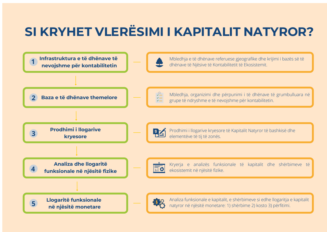
Figura 1. Qasja skematike dhe metodike për kryerjen e kapitalit natyror.

Ky raport është bazuar në metodologjinë e hartuar nga Prezenca e OSBE-së në Shqipëri sëbashku me Ministrinë e Brendshme (OSCE & MB, 2021). 2 Referuar kësaj metodologjie, është bërë i mundur përcaktimi i “përkufizimit” dhe kuadrit të kapitalit natyror, me punën e një sërë ekspertësh nga disiplina të ndryshme. Figura 1, më poshtë prezanton qasjen skematike të procesit të kryerjes së vlerësimit të kapitalit natyror, bazuar në metodologji.