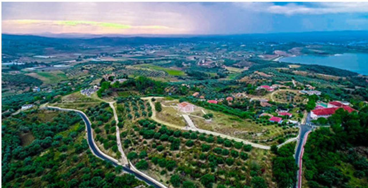
Figura 3 Pamje nga kodrat e zonës Roskovecit dhe Kisha e Shën kollit

Roskoveci njihet si një vendbanim i hershëm i pozicionuar në kryqëzimin e tre qyteteve të lashtë Apolonia, Berat e Bylis, pranë të cilit kalonte dhe një nga degëzimet e rrugës Egnatia. Një element tjetër i cili e vërteton lashtësinë e tij janë dhe tumat e Strumës. Bashkia Roskovec përbëhet nga 32.164 banor me një dendësi prej 184 banore për km 2 , sipas census të vitit 2011. 3