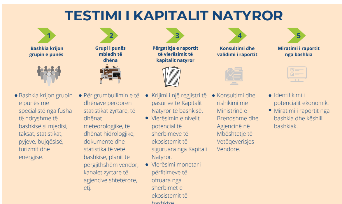
Figura 2. Vlerësimi i kapitalit natyror në bashki

Përfundimi dhe miratimi i raportit nga Bashkia. Raporti mbi KN, i strukturuar sipas metodologjisë, ka kaluar disa filtra në tërë prezantimin e tij. Pjesa narrative dhe ajo me të dhëna mbi llogaritë financiare, funksionet dhe vlerësimin e çdo aseti, ishte objekt i trajtimit të konsultimeve të gjëra profesionale dhe statistikore. Miratimi i parë informal i raportit ka kaluar nga grupi i punës në bashki dhe më pas raporti ka marrë edhe një miratim formal nga kryetarja e bashkisë.