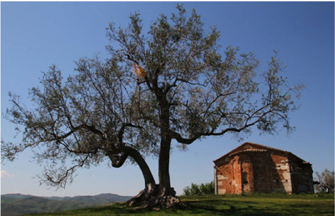
Figura 4 Kisha e Kurjanit shek. VIII

Kisha e “Shën Kollit” ndodhet në Kurjan është një monument i shekullit të XIII, i ndërtuar në stilin bizantin. Pikturat murale të cilat zbukurojnë brendësinë e kishës, janë veprat e ikonografit Nikolla, biri i Onufrit dhe ndihmësit të tij, Joanit.