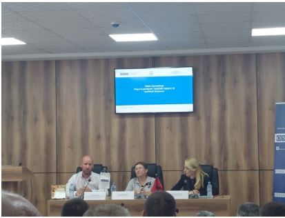
Shtojca A: foto nga Konsultimi i raportit kapitali natyror