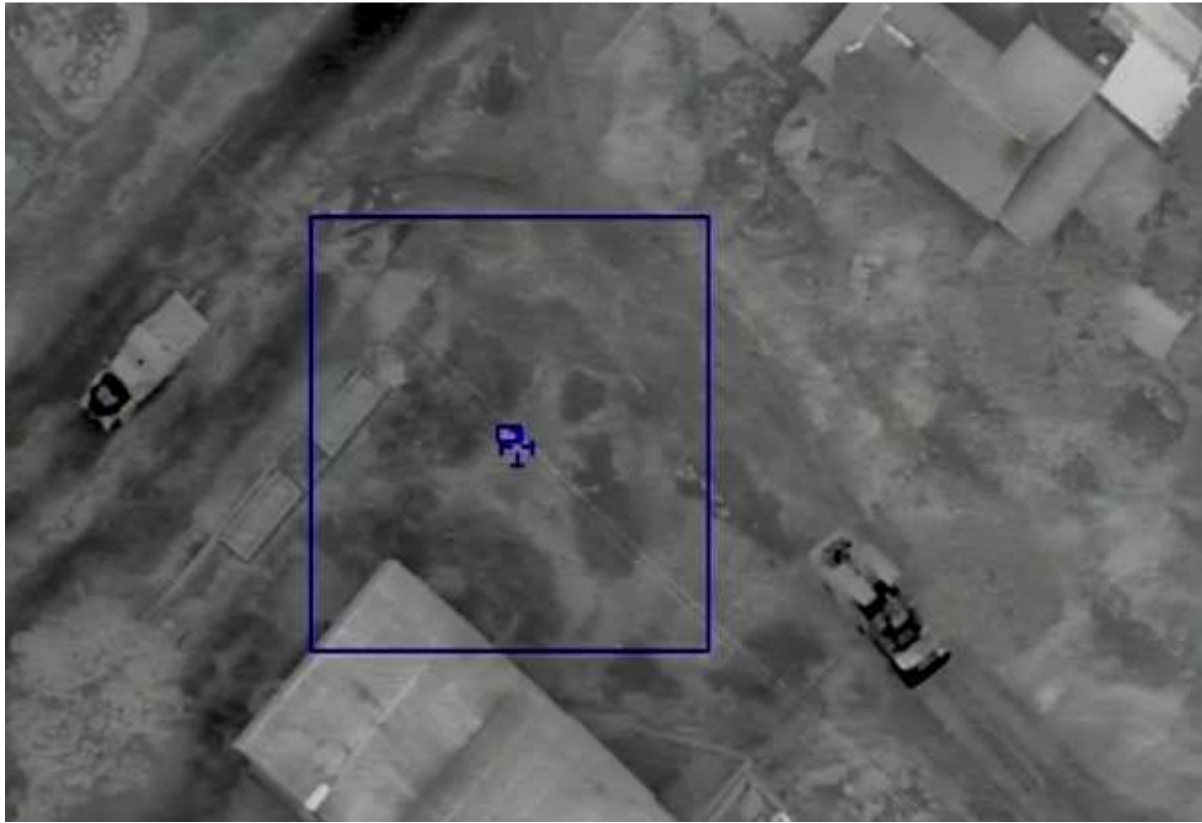
Мал. 1: На знімку видно зенітний ракетний комплекс (9К33 «Оса», 210 мм) та зенітну установку (ЗУ-23). Знімок було зроблено БПЛА над Корсунем 1 червня – за день до втрати зв'язку з ним.

ДОДАТОК: Знімок БПЛА, на якому зафіксовано зенітний ракетний комплекс і зенітну установку, та мапа місцевості