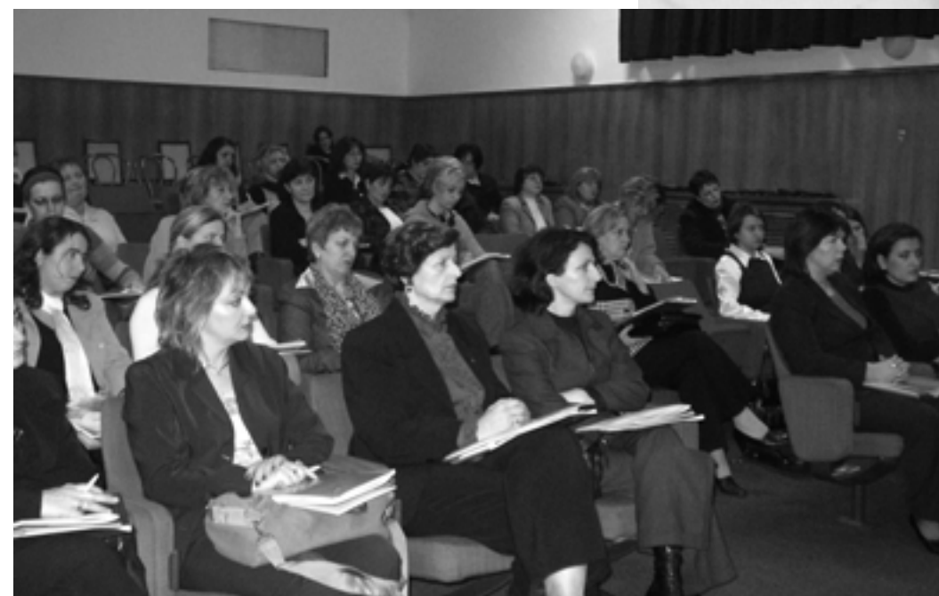
Евалуативна конференција - 10.12.2004 год., Клуб на пратеници, Скопје