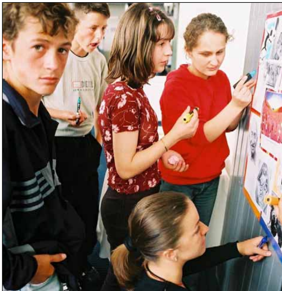
Obrazovanje o ljudskim pravima uvodi se u šeste razrede osnovnih škola. Prema međunarodnim preporukama, ovakva vrsta obrazovanja trebalo bi da postoji tokom čitavog ciklusa, od osnovnog do visokog obrazovanja.

Obrazovni program kosovskog obrazovnog sistema, koji je razvijen nakon konflikta 1999. godine i nakon uspostavljanja UN-ove privremene uprave, predstavljao je zapravo obnovljeni program preuzet iz bivše Jugoslavije. U svakom slučaju, nastava o ljudskim pravima nije bila u sastavu ovog programa.