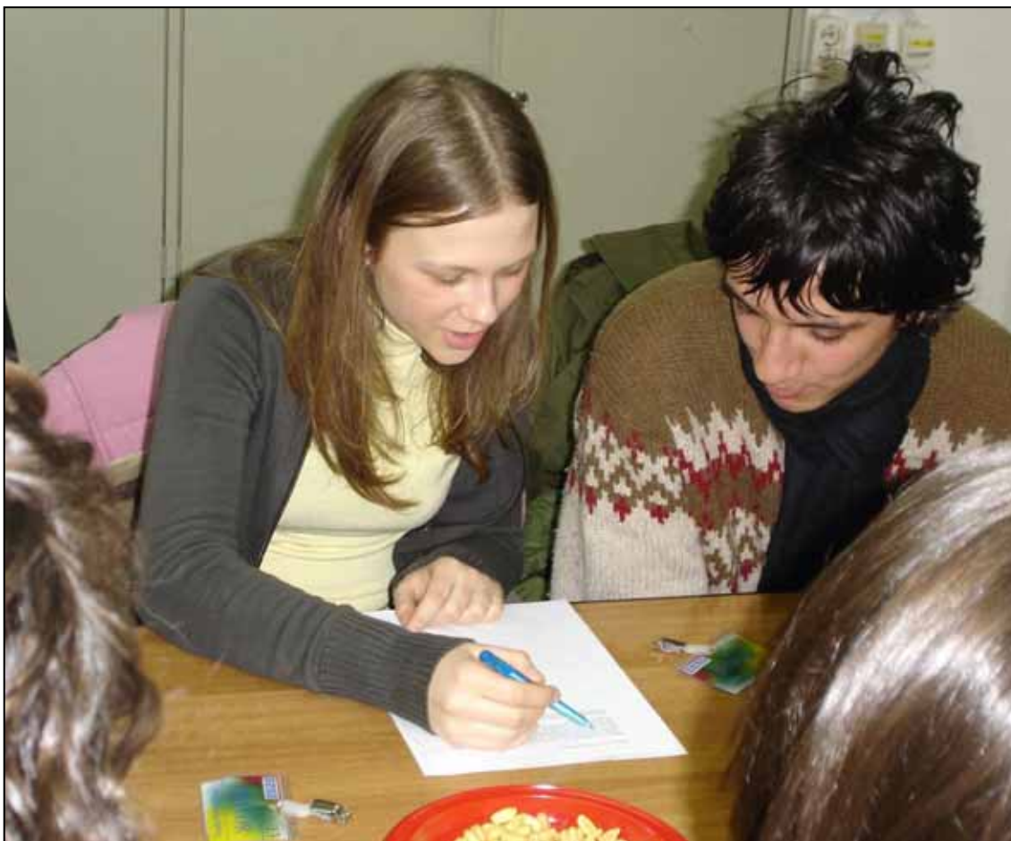
Kosovski pravni centar organizuje nastavu za decu i mlade različitog uzrasta, ali najviše za studente na fakultetima.

Ni ovde nije nedostajala obrazovna komponenta, jer su studenti prava imali ulogu mladih istraživača.