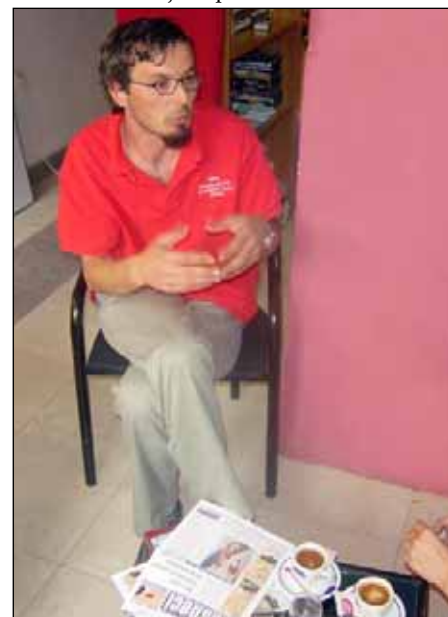
Novinari koji rade za časopis Glasnik pišu o problemima i događajima u svojim zajednicama. Oni doprinose zblizavanju lokalnih predstavnika vlasti i lokalnog stanovništva.

U nastojanju da obezbedi samoodrživost projekta, organizacija Oko vizije je nedavno počela da u časopisu objavljuje i reklame. “Obezbedili smo malo prostora za marketing”, kaže Mujaj, “pošto pokušavamo da nađemo način da postanemo samoodrživi”. Dok to ne postignu, Glasnik nastavlja da izlazi uz finansijsku podršku OEBS-a.