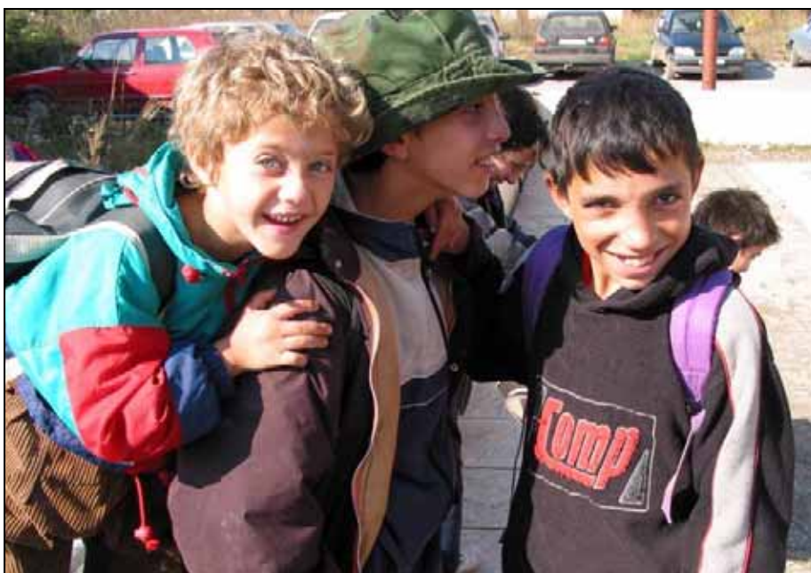
Deci iz zajednica kosovskih Roma, Aškalijske i Egipćana često je uskraćen pristup osnovnoškolskom obrazovanju. Dodatna nastava pomaže im da nadoknade propušteno.

Međutim, veoma često deca iz manjinskih zajednica na Kosovu ne pohađaju školu. To je posebno slučaj sa Romima, Aškalijskim i Egipćanima. Ovo ima negativan uticaj na društvo u celini i onemogućava generacije sposobnih pojedinaca da daju pozitivan doprinos životu na Kosovu.