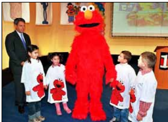
Ulica Sezam uskoro obeležava godišnjicu prikazivanja na Kosovu

I dok se na četiri televizije, kao i na krajnjem severu i jugu Kosova putem OEBS-ovih specijalnih projekata nastavlja prikazivanje serije, deca na Kosovu odrastaju smejući se i učeći uz Ulicu Sezam.