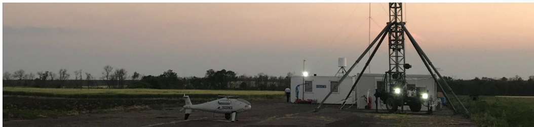
База БПЛА СММ дальнього радіуса дії в Степанівці (ОБСЄ)