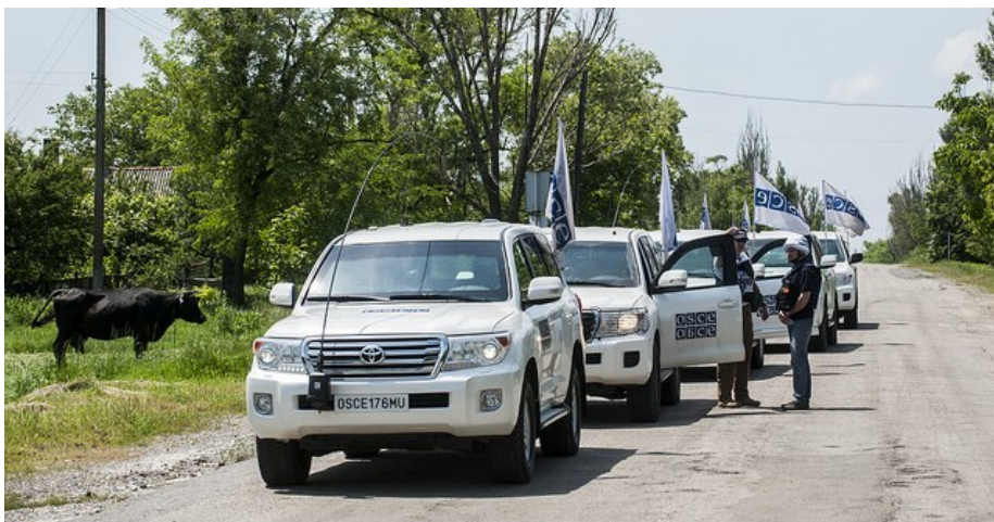
Спостерігачі СММ ОБСЄ під час патрулювання у Павлограді на сході України, травень 2016 р.