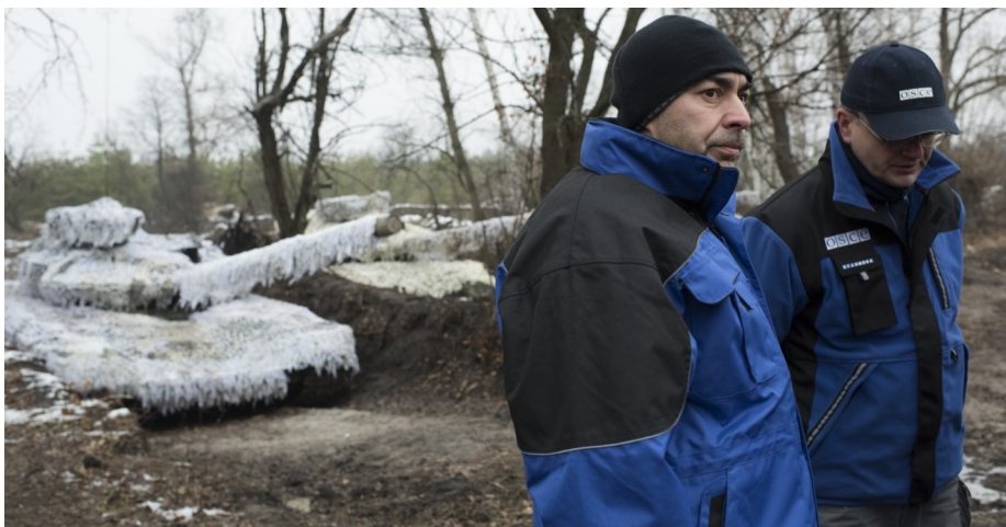
Спостерігачі СММ відвідують місце постійного зберігання озброєння, листопад 2015.