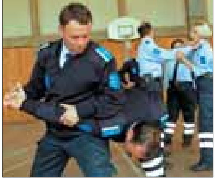
Vıçitrın'da bulunan Kosova Polis Hizmetleri (KPH) okulundaki eğitim

KPH'nin çok kısa bir dönemde ve dünyada hiç görülmemiş bir tempo içerisinde hızlı bir şekilde olgunlaşması bekleniyordu. Bütçe ve zamanın izin verdiği en kısa bir zaman dilimi içerisinde personel ve insane kaynaklarının memnun edici bir seviyeye gelmeleri yönünde hareket etmek gerekiyordu. İki hafta önceye kadar önceliklerin yerine getirilmesi için tüm bölümlerin elverişli olmadığı ayandı. Geçen ay meydana gelen olaylar gibi Kosova içerisinde yaşamakta olan herhagi bir topluluğa karşı gelecekte yapılabilecek olan herhagi bir saldırıya karşı gelmek için bazı önceliklerin uyumlaştırılması gerekir. Tüm Kosova içerisindeki yedekleri efektif ve çabuk koordine edecek olan komuta ve denetim merkeziningeliştirilmesibuyönde bir örnek olabilir. Dikkatli bir planlama yapılarak gerekli cihaz ve donatımın edinilmesinde de önemli bir başarı kaydedilmiştir. Bu olaylardan önce nizam ile intizamın örgütlü bir şekilde bozulması istendiği durumlarda, KPH'nin elindeki mevcut donatımı kullanmak zorunda