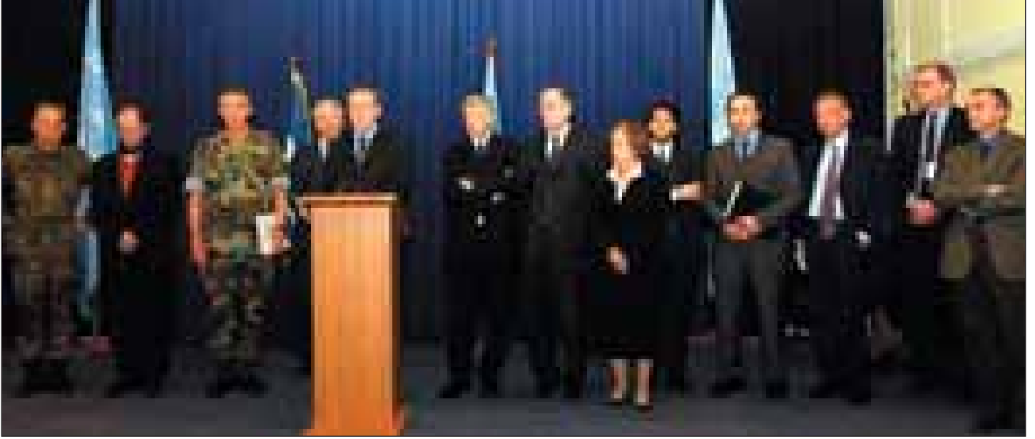
GSÖT Holkeri, Kosova liderleri, KFOR ve Beşler Gurubu (Quint) ülkelerinin 17 Mart tarihinde yayınlanan konuşmaları

Kosova'daki güvenlik durumunun dramatik bir şekilde kötüleşmeye başlaması ve özellikle Sırp ve bazı Rom topluluğu mensuplarının Arnavutlar tarafından saldırıya uğramasıyla, tüm gözler trajik gelişmeler karşısında Kosova liderleri ve enstitülerinin olaylara karşı tutumuna çevrildi. Aşağıda Kosova siyasetçileri tarafından verilen en ilginç ifadelerinden kısa özetler verilmiştir. Metin içeriğinde ayrıca Kosova siyaseti ile uğraşan temel uluslararası aktörlerin de ifadelerine yer verilmiştir, ki bu krizin atlatılması doğrultusunda karar-verici mercilerin yaklaşımlarını daha iyi anlamamıza yardımcı olabilir.