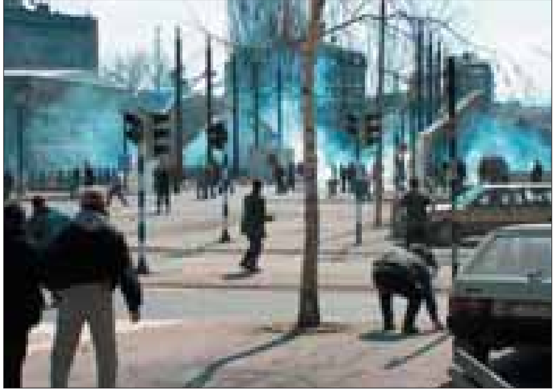
17 Mart tarihinde Mitroviça