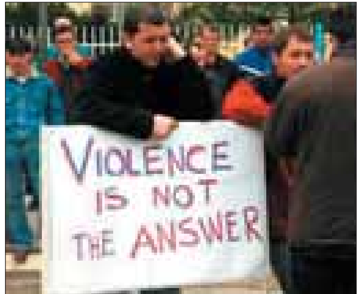
Sivil toplulukların kargaşalara karşı gösterisi

NATO Genel Sekreteri Jaap de Hoop Scheffer’in 22 Mart tarihinde gerçekleştirdiği Kosova ziyaretinden önce verdiği ifade: “Kosova’da hiç kimse ve çoğunluğu oluşturantopluluk olan Arnavutlar şiddet uygulamakla kendi politik isteklerini daha kolay gerçekleştirebileceklerin i zannetmesin.... Aslında onlar bunu farkettilerinde bunun daha uzun süreceğini anlayacaklardır.”