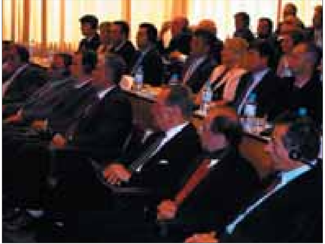
GSÖT Holkeri, Başkan Rugova, Başbakan Reçepi ve Meclis üyeleri

İçlerinden bazıları bu kriminelleri kahraman olarak görmektedir. Aralarından bazıları 1999 yılından önceki baskı ve zorba rejimine karşı direnişe katılmış olabilirler. Fakat baskı ve zorbaya karşı direniş ve savaş ile hiç bir günahı olmayan kişilere