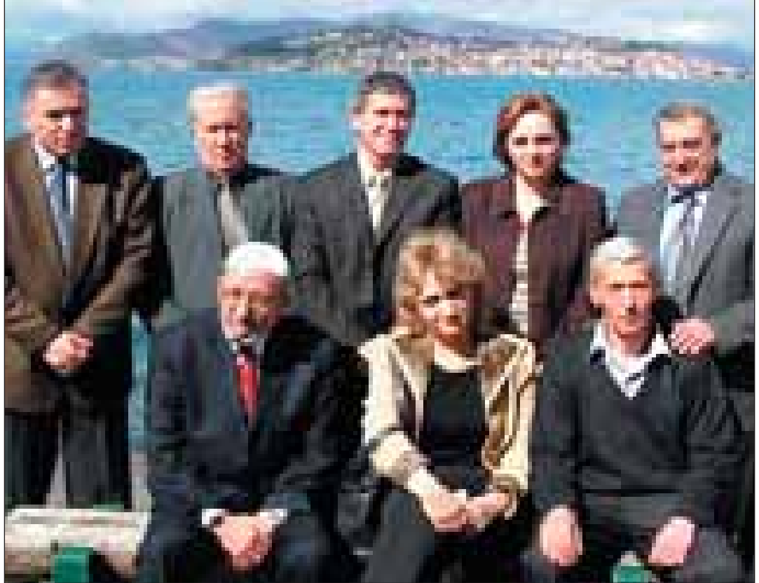
Diğer Topluluklar Parlamenter Grubu Ohrid’te