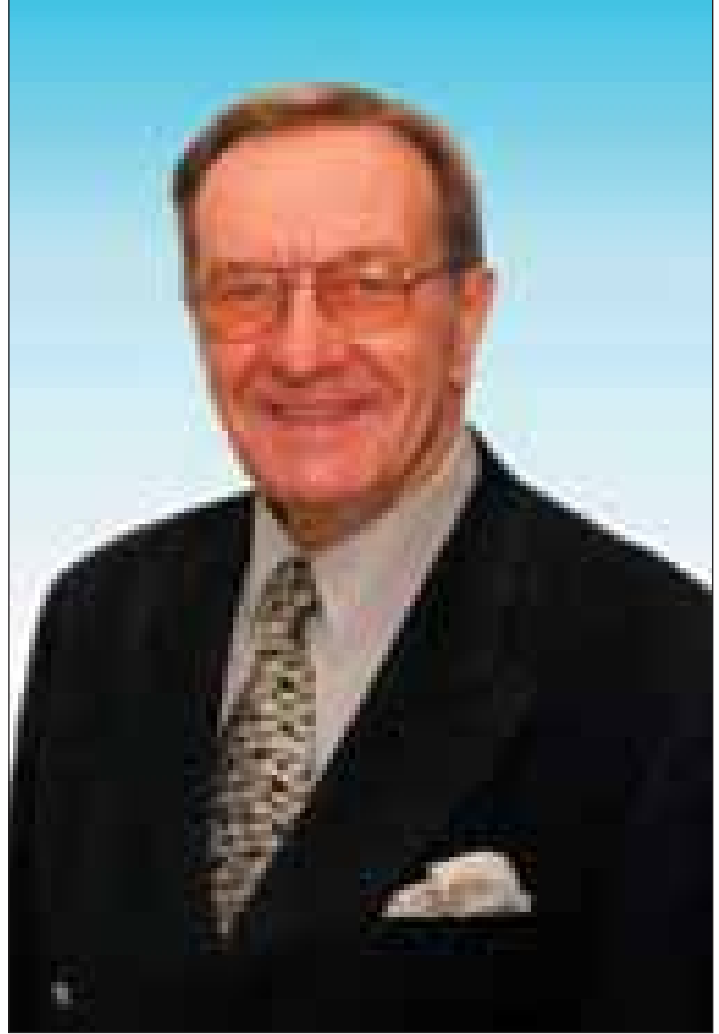
GSÖT Hari Holkeri

UNMIK kendine düşen rolü bilir. Bu durumda güce başvuran herkesi biz belirleyip adalet önüne çıkaracağız. Polisin yaptığı araştırma ve incelemeler sonucu mart ayında kaba güce başvuranların çoğu belirlenmiş ve kendilerine karşı ceza işlemleri başlatılmıştır. Dahja çok sayıda insan işledikleri suçlar için mahkeme önünde hesap vereceklerdir.