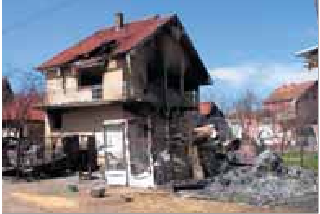
18 Mart tarihinde Lipjan'da tahrip edilen bir bina

"Böyle bir yaklaşımdan Arnavutlar da kârlı çıkacak, çünkü böylelikle onlar kendi çıkarlarına aslında elverişli olmayan şovenliklerinden kurtulacaklardır. En nihayet uluslararası topluluk da kazançlı çıkacak, çünkü ekstremistlerin ortadan kaldırılmasıyla onlar Av-