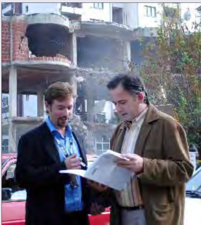
E drejta pronësore është një ndër të drejtat themelore të njeriut. Në të shumtën e rasteve, ndërtimet pa leje ose uzurpimet e pronës së huaj vështirësojnë mundësinë e dikujt për të ushtruar të drejtën pronësore të tij/saj.

Përveç kësaj, përpjekjet e dobëta për reformim të legjislacionit dhe krijim të mekanizmave të pamjaftueshëm ad hoc për të zgjidhur kontestet pronësore, si dhe atmosfera e përgjithshme e jostabilitetit dhe parregullsitë, kanë bërë që mbrojtja e së drejtës pronësore të jetë një nga prioritetet kryesore të OSBE-së.