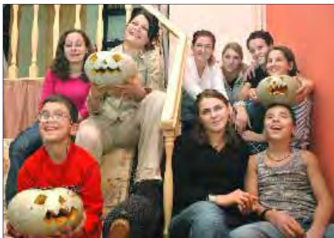
Grupet sociale të ndjeshme - gratë dhe fëmijët - janë shpesh viktimë e formave të ndryshme të diskriminimit. Strehimi i tyre nganjëherë është zgjidhja e vetme. Misioni i OSBE-së përkrah punën e një numri të strehimoreve.

Neni 2 (a) i Ligjit Kundër Diskriminimit