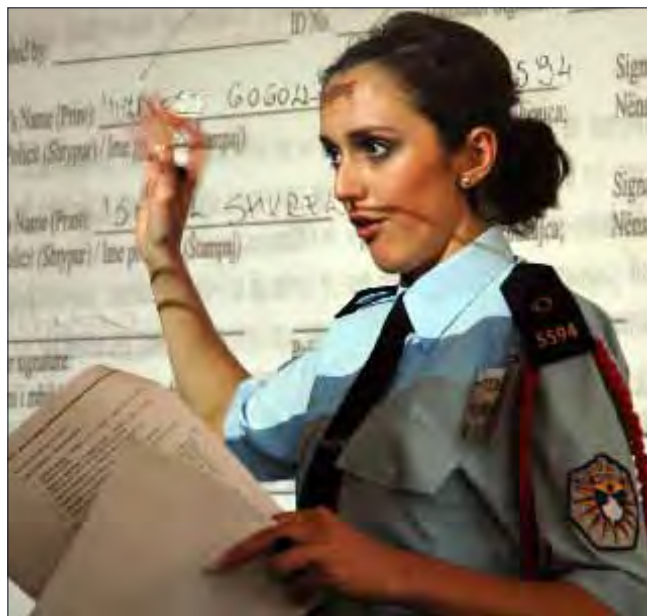
Forca policore luan rol të madh në sigurimin e sundimit të ligjit dhe mbrojtjen e të drejtave të njeriut. Andaj, edukimi i tyre dhe respektimi i praktikave të të drejtave të njeriut janë ndër prioritetet e Misionit të OSBE-së.

Zbatimi i suksesshëm i programit varet shumë nga besimi i ndërsjellë në mes të policisë dhe EDNJ-ve. Kjo, gjithashtu, varet nga përkushtimi i të gjitha palëve të përfshira që mbrojtjen e të drejtave të njeriut ta marrin si bazë dhe arsye në punën e tyre.