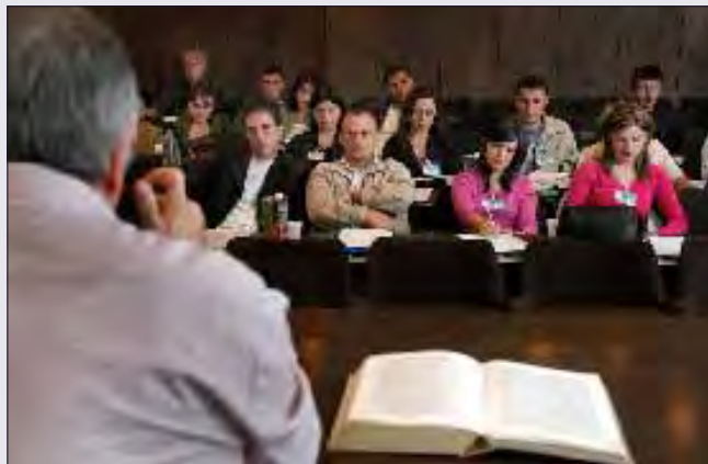
Pas monitorimit të sistemit gjyqësor, Misioni i OSBE-së publikon rekomandime dhe e këshillon gjyqësorin se si të përmirësojë funksionimin e tij dhe të ofrojë mbrojtje më të mirë të të drejtave të njeriut.

Përderisa Misioni pranon se që nga rithemelimi i sistemit të drejtësisë në Kosovë në vitin 1999 e deri më sot është arritur mjaft, mbetet ende shumë punë për t'u bërë. Së shpejti, një numër i konsiderueshëm i kompetencave brenda administratës së drejtësisë do t'u transferohet autoriteteve vendore. Misioni do të monitorojë këtë proces dhe do të vazhdojë të sigurojë se administrata e drejtësisë në Kosovë është në pajtim të plotë me standardet e aplikueshme ndërkombëtare të të drejtave të njeriut.