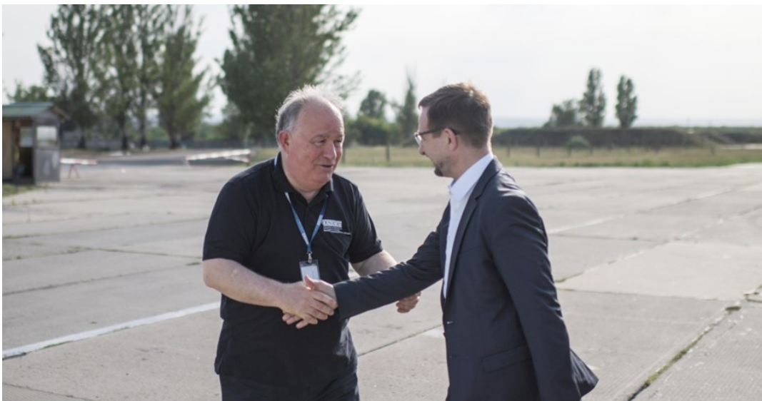
Генеральний секретар ОБСЄ Томас Гремінгер (праворуч) та Голова Спеціальної моніторингової місії ОБСЄ в Україні посол Ертурул Апакан, 26 липня 2018 року.