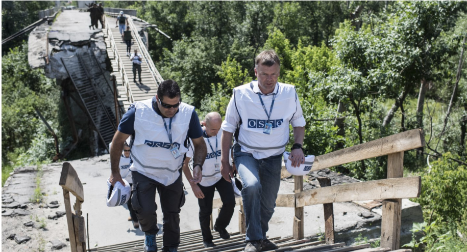
Спостерігачі СММ оцінили ситуацію біля мосту в Станиці Луганській, липень 2015 р.