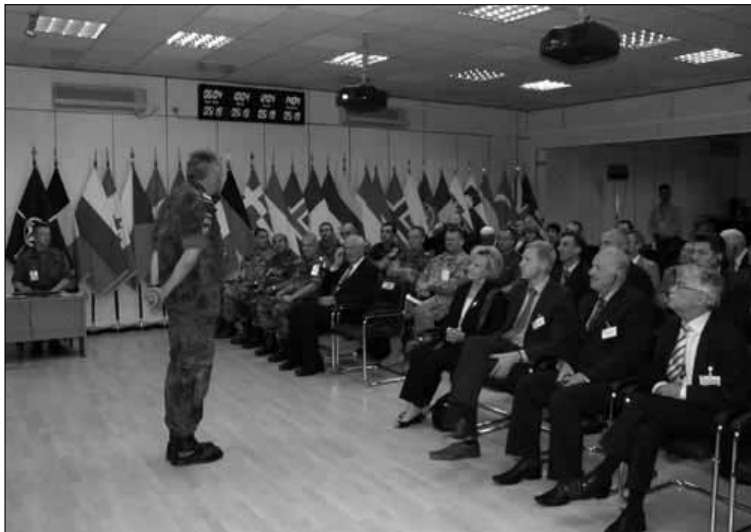
Komandant KFOR-a, General Kater, obraća se učesnicima u Filmskom Gradu

Regionalna konferencija o parlamentarnom nadzoru bezbednosti i sektoru javne bezbednosti treća je konferencija šireg regiona priređena zajednički od strane misije OEBS-a na Kosovu i Skupštine Kosova. Prethodne konferencije bavile su se nadzorom budžeta (2005. godine) i nadzorom policije (2006). Međutim, ova konferencija bila je prva koja je održana nakon uspostavljanja parlamentarnog Odbora za bezbed-