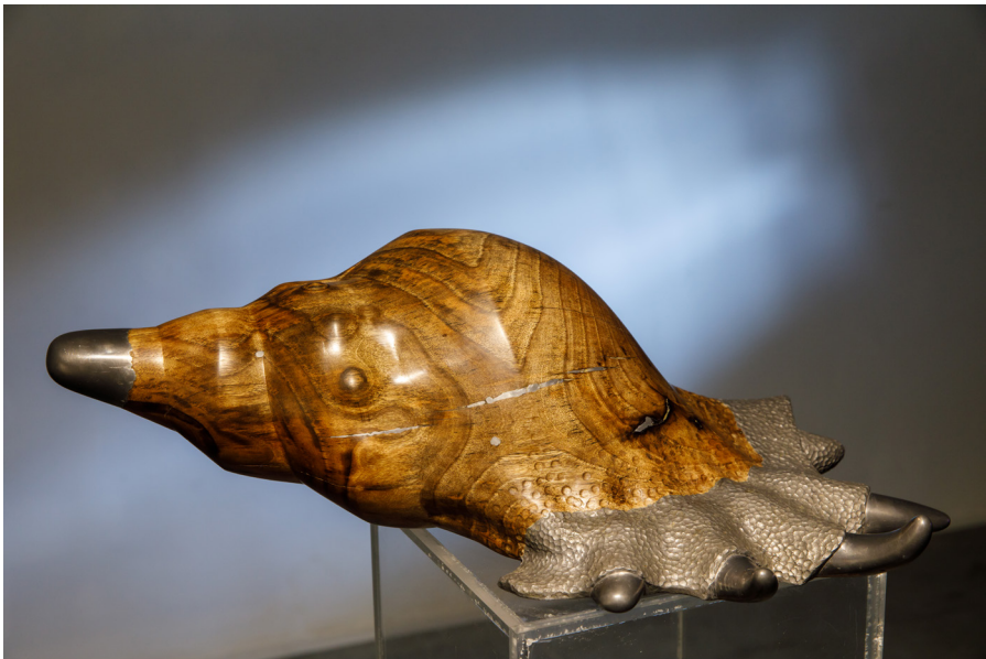
Autor: Silver Balla, përgatitur në kuadër të Konkursit Studentor të Artit Pamor Prezenca e OSBE-së në Shqipëri, 2018