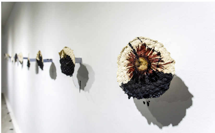
Autor: Marinela Mino, përgatitur në kuadër të Konkursit Studentor të Artit Pamor Prezenca e OSBE-së në Shqipëri, 2018