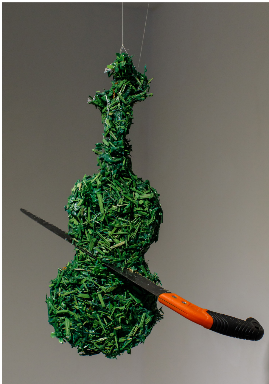
Autor: Romina Idrizi, përgatitur në kuadër të Konkursit Studentor të Artit Pamor Prezenca e OSBE-së në Shqipëri, 2018