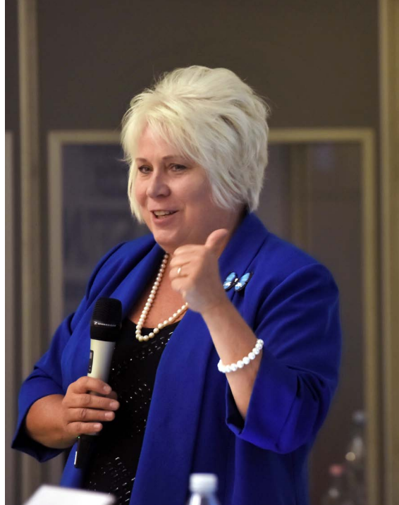
MARINA KALJURAND NAGYKÖVET (Észtország) interakciója a közönséggel a magas szintű panel során