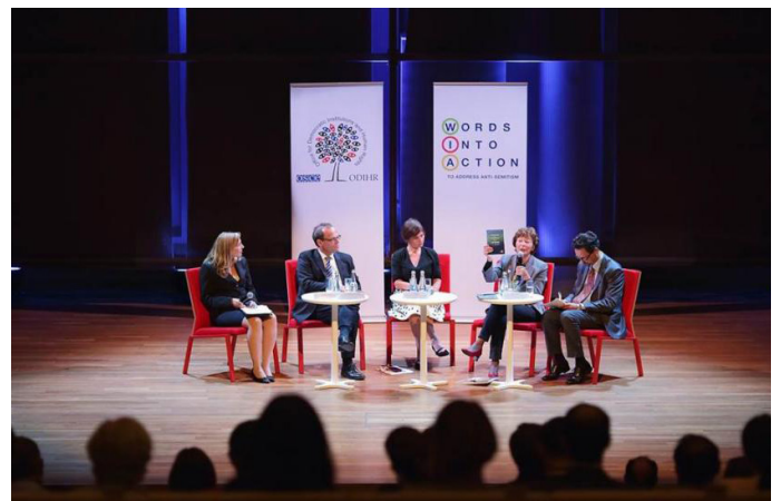
Panel diskutimi i organizuar nga ODIHR dhe Museumi POLIN në Varshavë me theks të veçantë në rolin e arsimit në luftimin e anti-semitizmit dhe format e tjera të intolerancës, 28 Shtator 2016.