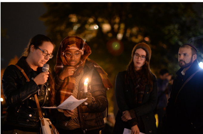
Vigilje për përkujtimin të viktimave të sinagogës së Pitsburgut, 28 Tetor 2018, Uashington, DC.

Krimet anti-semite të urrejtjes paraqiten kudo në rajonin e OSBE-së. Raporti i ODIHR-it tregon se incidentet e urrejtjes anti-semite përfshijnë sulme kundër hebrenjve si mbi baza fetare, ashtu edhe mbi baza etnike. Krime të tilla mund të ndodhin në ose përreth festave fetare hebraike dhe ditëve me rëndësi historike, duke përfshirë ditët përkujtimore të Holokaustit. Autorët e krimeve të tilla shpesh përdorin stereotipe të dëmshme,