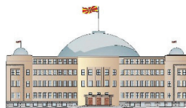
Kuvendi i Republikës së Maqedonisë së Veriut