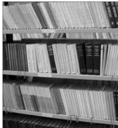
Libra për të gjithë

të OSBE-së Fieski, dyert e saj kanë qenë të hapura për çdo fëmijë, burrë e grua, pa marrë parasysh se kush janë ata. Bashkëpunimi ndëretnik me të vërtetë ka sjellur rezultate nga të cilat do të përfitojnë të gjitha komunitetet.