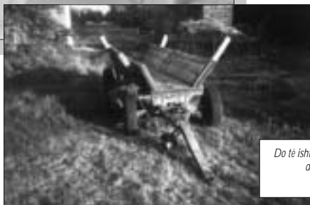
Do të ishte mirë ta hedhim anash të kaluarën dhe t'i kthehemi së ardhmes. Nga Ivana Shugiq