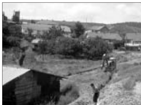
Sistemi i ri i ujësjellës në Koloninë e Vjetër

Kur e pyetëm z. Mekoj se si duket tani sallja e Kuvendit Komunal, ai duke qeshur tha, "tani është krejt ndryshe, e rimodeluar dhe e paj-