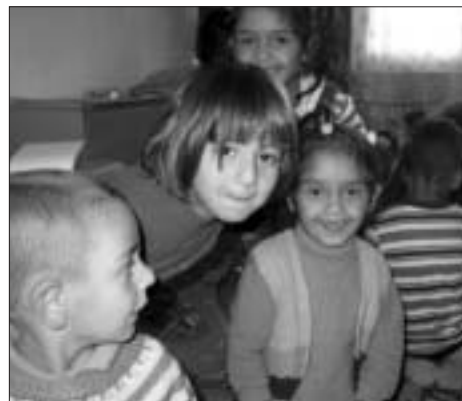
Fëmijët romë duke u argëtuar në kopshti e fëmijëve

"Shpresojmë që kopshti do të ekzistojë përgjithmonë dhe do të përkrahet nga komuna në mënyrë që të vazhdojë tu ndihmojë fëmijëve romë të integrohen në shkolla fillore dhe me nxënës nga komunitete të ndryshme," shtoi z. Ansedo.