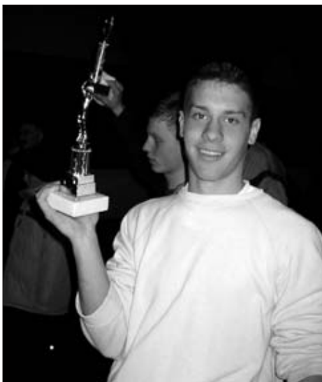
Një anëtar i ekipit fitues duke festuar