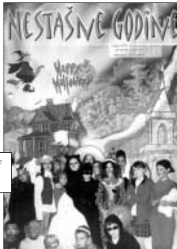
Të gjitha projektet kanë pasur një ndikim të konsiderueshëm në cilësinë e jetës të të gjitha bashkësive etnike Nga Brian Jupp