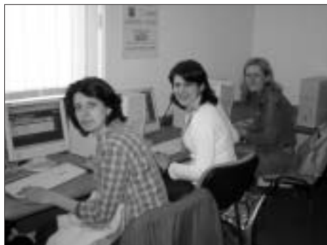
Të rinjtë të bashkësive të ndryshme gjatë trajnimeve të teknologjisë informative

lokale 'Piramida-Dituria', qendra u ka mundësuar egjiptasve të rinj, si dhe të rinjëve nga komunitet shqiptarë, boshnjake dhe rome, t'i shfrytëzojnë shërbimet në internet pa pagesë. Në të vërtetë, koordinatori i OJQ-ës