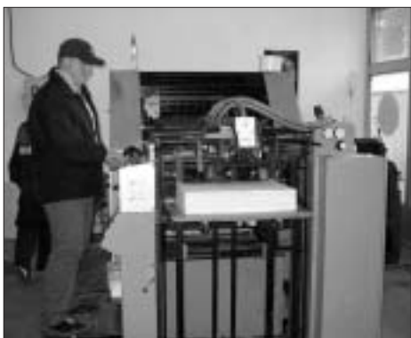
Shtypja i buletinit informativ

Nuk ka dyshim se të dy projektet e revistave u kanë ndihmuar anëtarët e rinj të zhvillojnë aftësitë e tyre dhe të mësojnë më tepër se si jeton pala tjetër. Ata kanë mësuar edhe për atë se si të jetohej së bashku në Kosovë