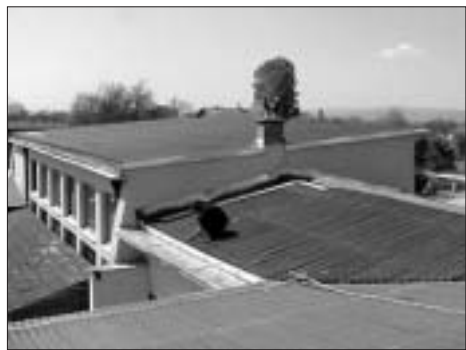
Çatia e re e shkollës në Vrboc

Më së 407,739 Euro, nga shumata e përgjithshme e buxhetit të 'FIVM-it' u janë dedikuar 14 projekteve të ndryshme në infrastrukturë. Në shumë raste, këto projekte kanë ndikuar pozitivisht në përmirësimin e standardit jetësor të komuniteteve.