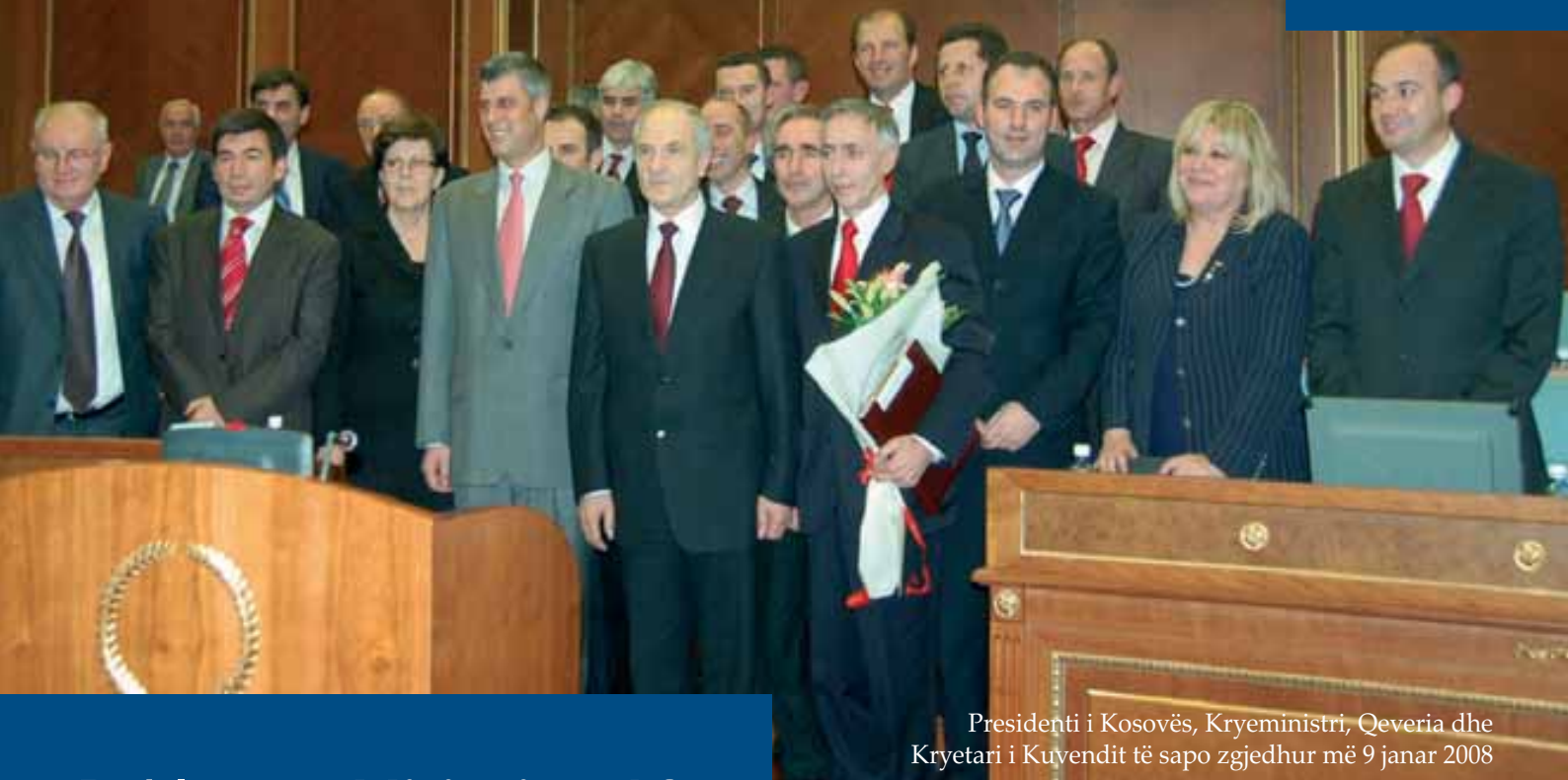
Presidenti i Kosovës, Kryeministri, Qeveria dhe Kryetari i Kuvendit të sapo zgjedhur më 9 janar 2008