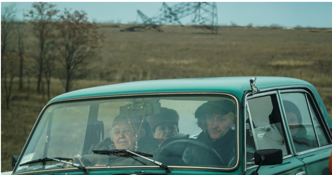
Цивільні особи, які перетинають лінію зіткнення поблизу Мар'їнки в Донецькій області