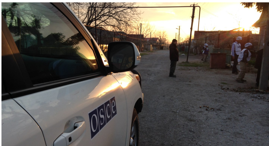
СММ впервые провела ночное наблюдение в Широкино, 17-18 апреля