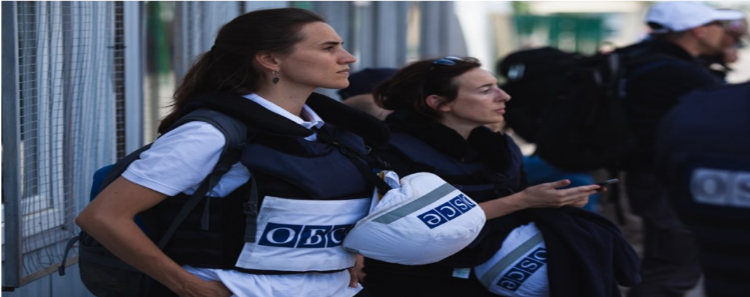
Співробітники СММ біля мосту поблизу Станції Луганської (Віктор Конопкін/ОБСЄ)