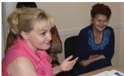
Участники во время тренинга для консультантов «горячей линии» по вопросам домашнего насилия

Центр продолжил оказание содействия общественной организации «Кейик Окара» в предоставлении услуг «горячей линии» по домашнему насилию. В июле 2010 года «Кейик Окара» организовала двухдневный обучающий курс по проведению телефонного консультирования по вопросам, касающимся домашнего насилия. 11 представителей организации, в том числе консультанты «горячей линии», юристы, волонтеры и психолог, ознакомились с основными принципами телефонного консультирования, а также получили рекомендации касательно работы с трудными случаями, включая случаи молчания по телефону. Программа курса, также охватывала стратегии предотвращения профессионального «выгорания», этический кодекс