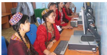
Студенты во время занятий в Консультативном центре по диверсификации посевов и ирригации (СИДАК)

Сентябрь 2010г. ознаменовался открытием Консультативного центра по диверсификации посевов и ирригации (СИДАК) в здании Школы агробизнеса в