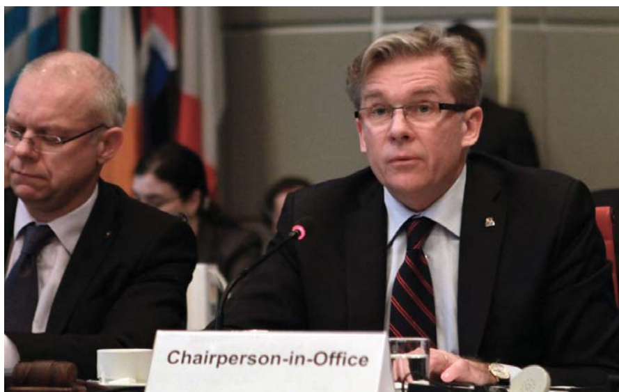
Действующий председатель ОБСЕ, министр иностранных дел Литвы Аудронюс Ажубалис

В своем обращении к Постоянному Совету ОБСЕ в Вене 13 января новый Действующий председатель ОБСЕ, министр иностранных дел Литвы Аудронюс Ажубалис призвал государства-участники Организации сосредоточить усилия на разрешении существующих конфликтов и достижении реального прогресса в решении проблем транснациональных угроз и обеспечении гарантий основных свобод.