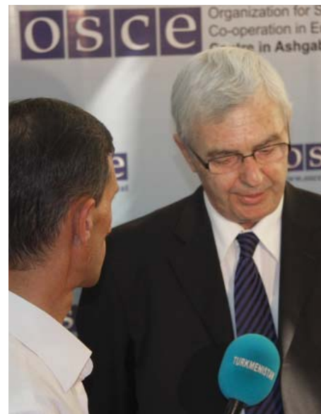
Бывший Президент Албании Реджеп Мейдани дает интервью для телевидения Туркменистана после лекции в Институте международных отношений

Говоря о Вашем визите в Туркменистан, не могли бы Вы рассказать нашим читателям о главных моментах Вашего визита? Что Вас больше всего поразило в Туркменистане?