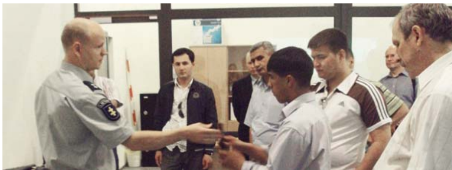
Сотрудники правоохранительных органов Туркменистана во время визита в Университет имени Мыколаса Ромериса, г. Каунас

Во время визита в Департамент полиции Министерства внутренних дел участники ознакомились со структурой полиции Литвы, принципами набора, учебными заведениями по подготовке сотрудников полиции и программами международного сотрудничества. Делегация также посетила Центр криминалистических исследований при Департаменте полиции. В городе Тракай делегация встретилась с сотрудниками Литовской школы полиции и ознакомились с учебной программой.