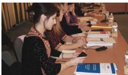
Участники семинара по антикоррупционным правовым инструментам

В рамках семинара была также представлена версия на туркменском языке «Технического руководства к Конвенции ООН по борьбе с коррупцией»,