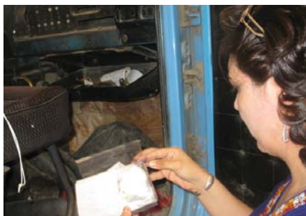
Участница обучающего курса для сотрудников таможни во время практического занятия, г. Дашогуз