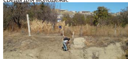
Строительство дамбы поможет снизить риск селевых потоков (село Гараул, Ахалский велаят)

Центр продолжал расширять границы своей деятельности в сельской местности и приступил к осуществлению проекта «Защита от селевых потоков и рекультивация деградированных земель» в нескольких горных поселках в Ахалском велаяте. Проект был разработан в целях снижения риска селевых потоков, создания новых источников водоснабжения и использования новых земель для возделывания сельскохозяйственных культур. В рамках проекта, который осуществлялся с сентября по декабрь, была построена дамба в русле селевого потока в поселке Гараул и проведены два тренинга по вопросам окружающей среды для молодежи.