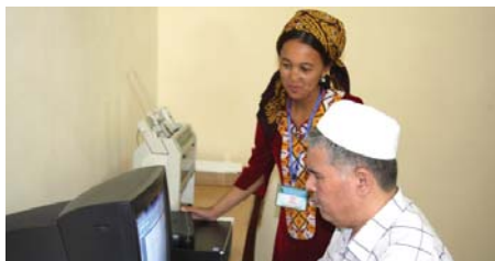
Сотрудники Школы для слепых детей проверяют оборудование для печатания школьных учебников по системе Брайля

В начале сентября 2010 года Туркменское общество слепых и глухих организовало церемонию с целью передать Школе для слепых детей оборудование для печатания школьных учебников по системе Брайля, которое было предоставлено Центром ОБСЕ. Оборудование, отвечающее последнему слову техники, включает принтер для печати по системе Брайля, монитор, компьютер и программное обеспечение, а также грифельные карандаши и устройство для письма по системе Брайля. Оборудование было предоставлено в рамках проекта Центра, направленного на улучшение доступа слепых детей к качественному образованию и реализованного при финансовой поддержке, полученной из благотворительных фондов ОБСЕ.