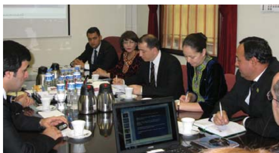
Делегация из Туркменистана обсуждает профессиональную подготовку сотрудников судов на встрече в Министерстве юстиции Турции, Анкара

Представители Верховного суда, Генеральной прокуратуры, Парламента и Министерства юстиции Туркменистана приняли