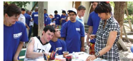
Участники лагеря изготавливают сувениры во время занятий

того, они принимали участие в занятиях, направленных на развитие некоторых профессиональных навыков, а также навыков жизни и создания сплоченного коллектива. Для участников лагеря были также организованы интерактивные занятия по искусству, пению и изготовлению сувениров своими руками.