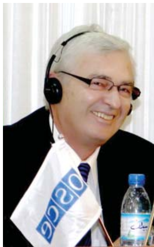
Бывший Президент Албании Реджеп Мейдани во время лекции в Институте международных отношений

Профессор Д-р Реджеп Кемал Мейдани (родился в 1944г. в г.Тиране, Албания), бывший Президент Албании (1997-2002г.г.). Реджеп Кемал Мейдани работал в должности профессора, руководителя кафедры, а позднее декана Факультета естественных наук (1966–1996г.г.). Его политическая карьера началась в 1990-х годах. Он был председателем Центральной избирательной комиссии во время первых выборов на основе многопартийного представительства кандидатов в 1991г. и членом Президентского Совета (1991г.). В 1996г. он вступил в Социалистическую партию и был избран ее Генеральным Секретарем (1996–1997г.г.). В июле 1997г. Ассамблея Албании выбрала Мейдани Президентом Республики. Экс-Президент в настоящее время является членом Мадридского Клуба.