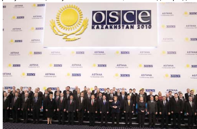
Главы государств и правительств позируют для общего фото на Саммите ОБСЕ в Астане, 1 декабря 2010 года

Декларация призывает выработать план действий под руководством будущих председательств.