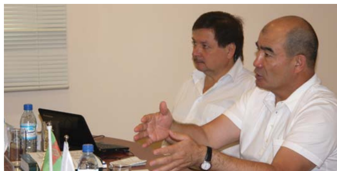
Эксперты во время летнего курса ОБСЕ по международно-правовым стандартам в системе уголовного правосудия

Организованный Центром ОБСЕ в сотрудничестве с