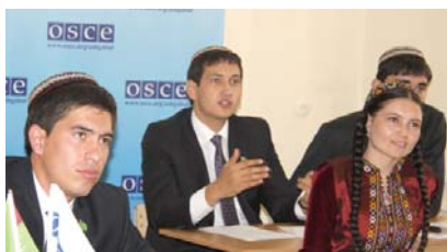
Студенты отделения «Международная журналистика» на лекциях по современной мировой журналистике

Будущие пресс-атташе, зарубежные корреспонденты и специалисты по связям с прессой приняли участие в лекциях по современной мировой журналистике, проведенных в Институте международных отношений. Трехдневный курс, состоявшийся в декабре, был разработан для студентов третьего курса отделения «Международная журналистика», которые принимали участие в обучающем семинаре по СМИ, состоявшемся при поддержке Центра в