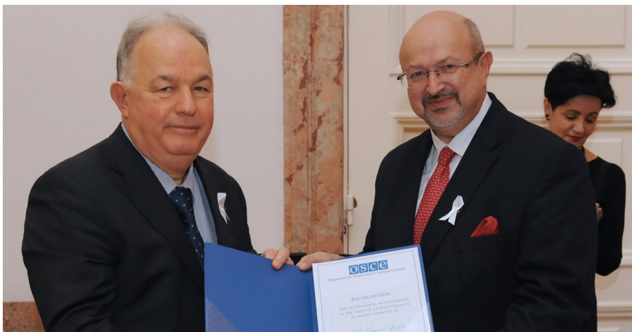
Голова СММ ОБСЄ, Ертурул Апакан (ліворуч), отримує пам'ятну білу стрічку, 1 грудня 2016 року.