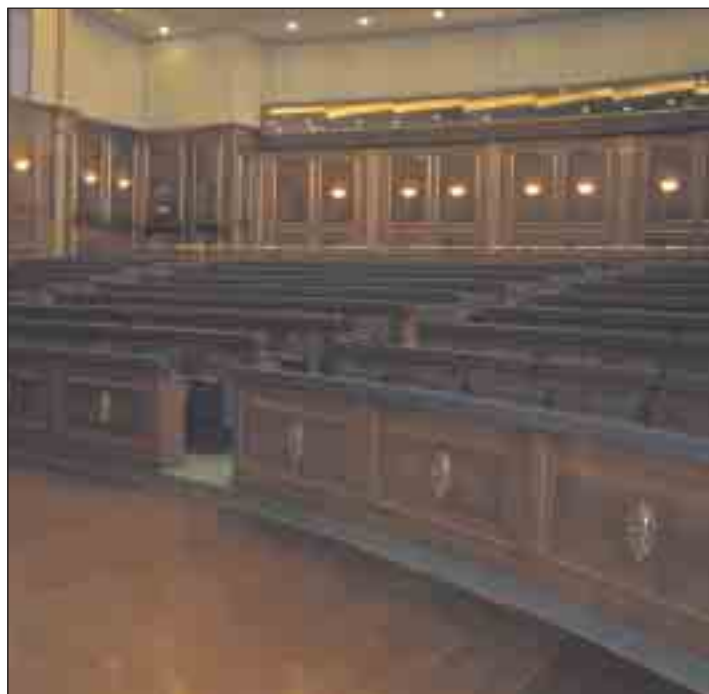
Slike renoviranog hola skupštine

Od sredine novembra 2003. do kraja januara 2004. godine, skupština je pregledala i usvojila nekoliko zakona. Neki zakoni su usvojeni na drugom iščitavanju navedenog datuma. Zakoni bez datuma samo su usvojeni na prvom iščitavanju, ali su – od kraja januara – još uvek na razmatranju u skupštinskim odborima: Zakon o sportu (21.11.2003.god.), Zakon o katastru (04.12.2003.god.), Zakon o drumskom transportu (15.01.2004.god.), nacrt Zakona o ravnopravnosti polova, nacrt Zakona o nediskriminaciji, nacrt Zakona o zdravstvu, nacrt Zakona o saradnji sa Međunarodnim krivičnim tribunalom zaduženim za zločine počinjene na teritoriji bivše Jugoslaviju (ICTY), nacrt Zakona o privrednoj komori, nacrt Zakona o trgovini naftom i naftnim derivatima na Kosovu, nacrt Zakona o kinematografiji.