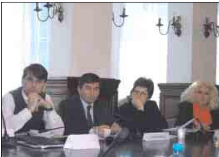
Zajedničko isčitavanje zakona protiv diskriminacije i jednakosti polova