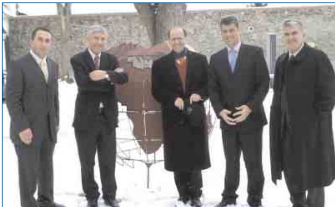
Zajedno u dvorcu Burg Schlaining: g-din. Ramush Haradinaj, g-din. Nexhat Daci, g-din. Ibrahim Rugova, g-din. Hashim Thaci i g-din. Bajram Rexhepi.

Konačna – lična – lekcija sa ovih sastanaka u studenom okruženju zamka Burg Šlening je sledeća: čini se da je "tajna uspeha" za postizanje željenog cilja iskrenog posvećenja duhu demokratskog kompromisa napuštanje prošlih uzajamnih optuživanja i isključivih stavova. Zahvaljujući neumornim naporima svih prisutnih, ova konferencija se pokazala kao obećavajuća vežba koja će nastaviti da koristi učesnicima.