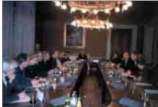
predstavnici odbora Skupštine Kosova sastaju se sa kolegama iz Austrijskog parlamenta

Sastanak sa g. Heincom Fišerom, koji je više godina bio predsednik austrijskog Parlamenta a sada je potpredsednik, imao je poseban značaj. G. Fišer je na početku svog govora pomenuo svoju posetu Kosovu 2002.g., na poziv Skupštine Kosova i OEBS. Reкао je da je upoznat sa trenutnom situacijom na Kosovu. Pored konsultacija i razmene informacija,