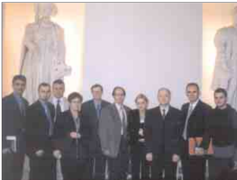
Kosovska delegacija u toku posete Belgijskom parlamentu u Briselu.