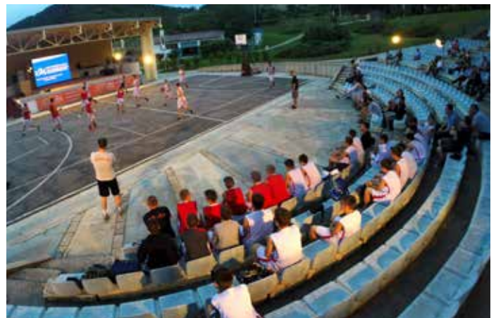
Vetëdijesimi i rinisë rreth vlerave të OSBE-së është prioritet i Misionit. Në një turne basketbolli për juniorë të organizuar në Prishtinë nga Misioni i OSBE-së, të rinj nga komunitete të ndryshme mësuuan për të drejtat e njeriut dhe tolerancën duke marrë pjesë në sport.

Misioni vazhdon t'i përkrah grupet për të drejtat e grave me fokus në ndalimin e dhunës së bazuar në gjini, dhe është aktiv edhe në punën me rininë përmes programeve të punës praktike në institucionet qeveritare.