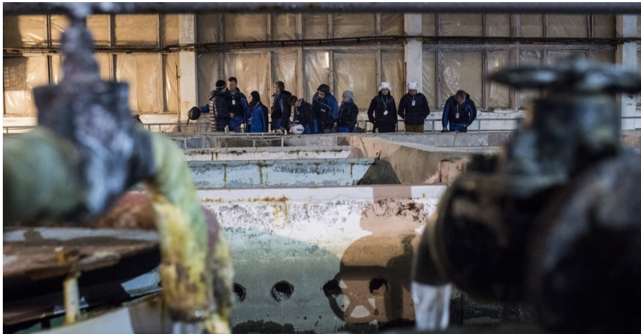
СММ ОБСЕ способствовала и осуществляла мониторинг возобновления работы Ясиноватской фильтровальной станции, 17 март 2016 г.