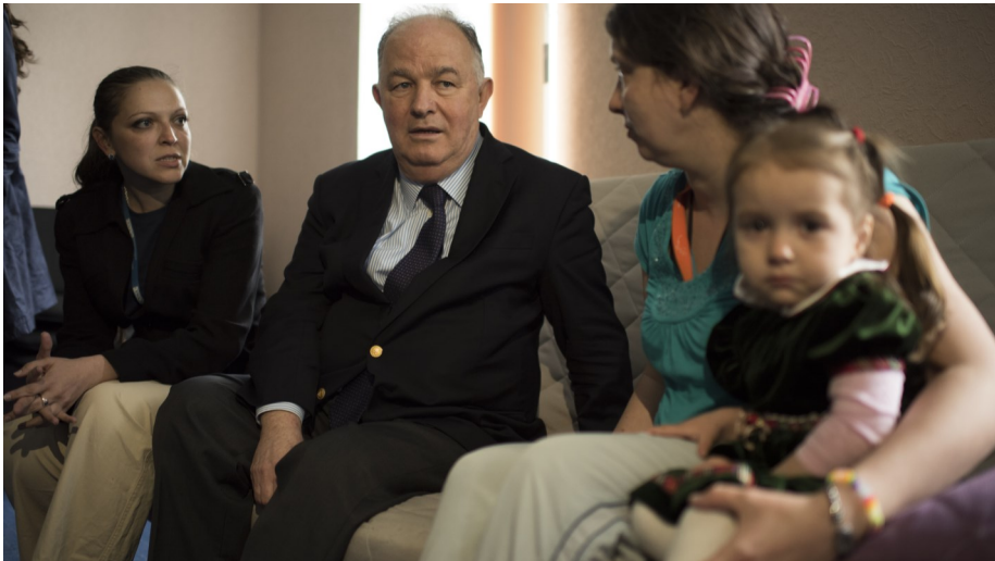
Голова СММ відвідує центр для внутрішньо переміщених у Слов'янську, травень 2015