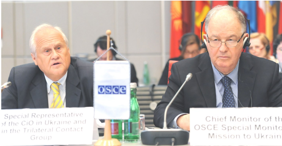
Голова Спеціальної моніторингової місії ОБСЄ в Україні Ертурул Апакан (праворуч) виступає на засіданні Постійної ради ОБСЄ у Відні, 28 липня 2016 року.