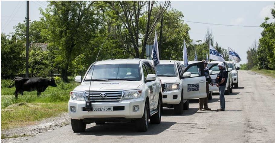
Наблюдатели СММ ОБСЕ во время патрулирования в Павлополе, на востоке Украины, май 2016 г.