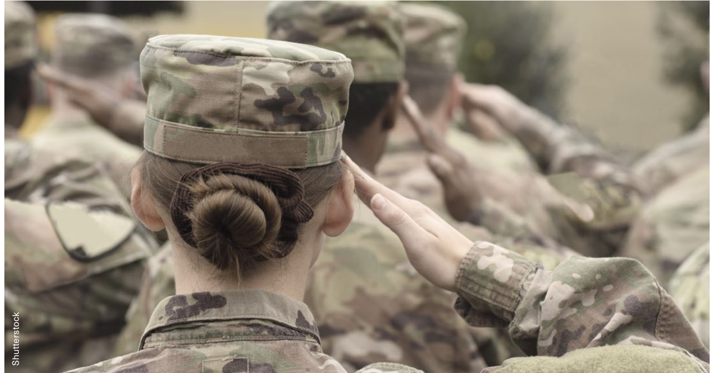
БДИПЧ содействует улучшению условий для службы женщин в вооруженных силах по всему региону ОБСЕ.

В ходе мероприятия участники улучшили свои знания о проблеме гендерных стереотипов, процедурах сообщения о нарушениях и их рассмотрении, а также о различных учебных и образовательных инициативах; по итогам обсуждения были разработаны практические рекомендации для военных структур. Представители профсоюзов военнослужащих сообщили, что теперь они используют информацию, полученную в рамках дискуссий, организованных БДИПЧ, при переговорах с работодателями. Помимо этого, они смогли использовать примеры хорошей практики, сложившейся в других государствах-участниках ОБСЕ, для более эффективной защиты и отстаивания прав военнослужащих в своих собственных странах. Другие участники сообщили Бюро, что теперь они более активно занимаются мониторингом инцидентов, связанных с насилием и домогательствами, и готовы более эффективно оказывать поддержку военнослужащим, сообщающим о случаях преследования, насилия или плохого обращения.