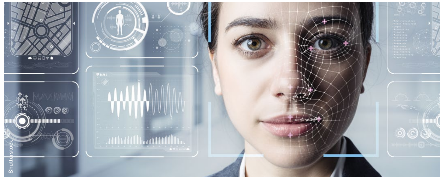
Данные программы распознавания лиц, используемые в целях пограничного контроля, вызывают озабоченность с точки зрения прав человека.

Новая серия экспертных семинаров стала первой в своем роде в регионе ОБСЕ. Затем, в сентябре 2020 года, БДИПЧ организовало параллельное мероприятие на эту тему в рамках Контртеррористической конференции, проводившейся для всех стран региона ОБСЕ. Основные выводы по итогам этих экспертных консультаций Бюро представило в рамках последующих мероприятий ОБСЕ, с тем чтобы повысить уровень осведомленности о тех угрозах для прав человека, которые могут возникнуть в связи с использованием новых технологий для обеспечения пограничного контроля. Итоги данной серии вебинаров, а также соответствующих последующих шагов легли в основу дискуссий