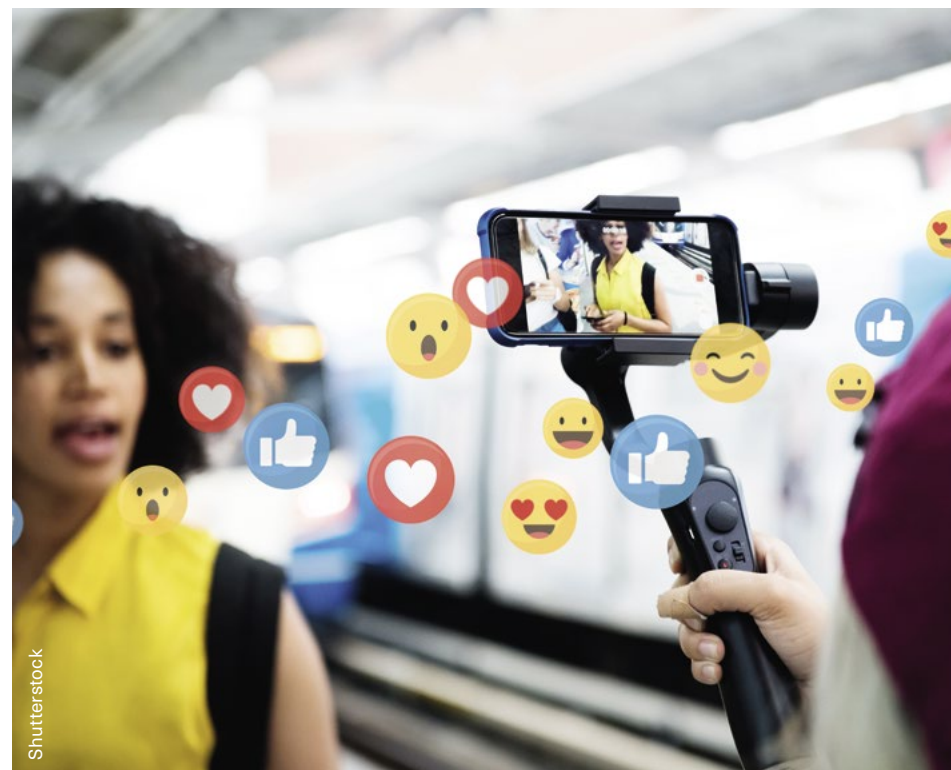
Молодежь активно участвовала в онлайн-дискуссиях во время пандемии COVID-19.

БДИПЧ считает, что поощрение контактов между молодежью, парламентариями и представителями международных организаций, частного сектора и других заинтересованных молодежных структур может оказать долгосрочное влияние на ситуацию в регионе ОБСЕ. Данный подход основан на использовании так называемого «демографического бонуса», который означает, что инвестирование в молодежь сегодня окажет положительное воздействие на все общество завтра, когда эти юноши и девушки займут должности в демократических институтах и других организациях, работающих на благо общества. Таким образом, Бюро предлагает молодежи стартовую возможность для участия