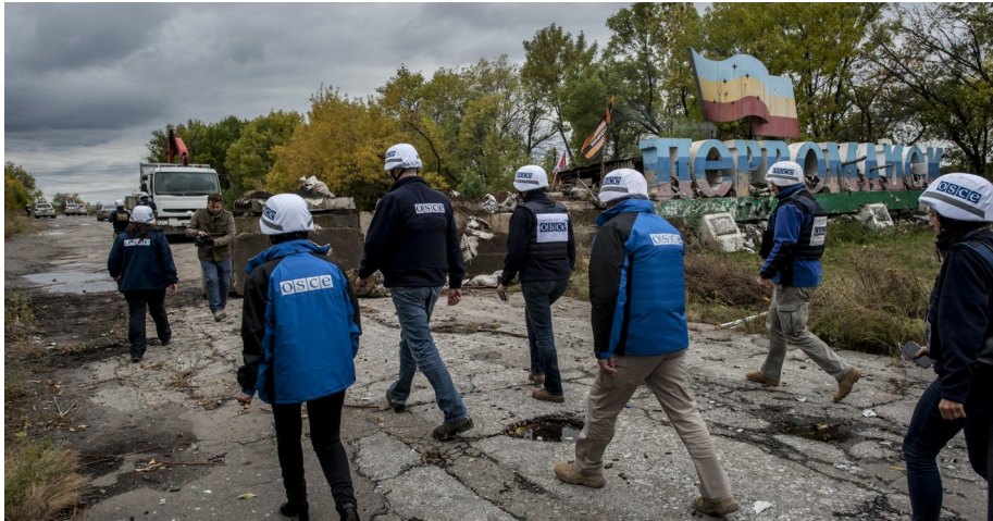
Спостерігачі СММ ОБСЄ здійснюють патрулювання в районі Золотого-Первомайська, Луганська область, 26 вересня 2016 року.