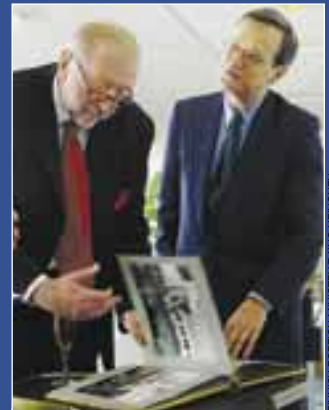
FINNISH FOREIGN MINISTRY/PAO HEINONEN

Нынешнем летом сообщество ОБСЕ отметило 30-ю годовщину подписания хельсинского Заключительного акта рядом особых мероприятий. Статьи и ставшие историей фотографии, помещенные в данном выпуске журнала «ОБСЕ», преследуют цель мысленно вернуть нас к эпохе зарождения Хельсинского процесса и позволить нам ощутить, как праздновалась историческая дата – 1 августа 1975 года.