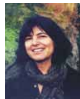
из частной коллекции

Хотела бы в заключение вспомнить слова премьер-министра Швеции Улофа Пальме. Когда здесь, в этом зале, подписывался хельсинкский Заключительный акт, президент Франции Жискар д'Эстен сказал: «Теперь все мы можем жить в согласии». «Нет, – возразил Улоф Пальме, – теперь мы можем начать не соглашаться друг с другом».