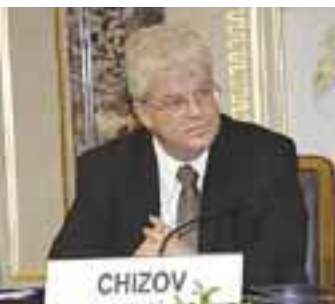
МИНИСТЕРСТВО ИНОСТРАННЫХ ДЕЛ АБСТРИХИОЛЦЕНЕР

Это тем более очевидно, если рассмотреть еще одну причину, по которой диалог в ОБСЕ нередко бывает относительно бесплодным. Нетрудно