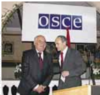
С РАЗРЕШЕНИЯ АЛЬФРЕДА МОИСТАРАДЖА

Албания подписала хельсинкский Заключительный акт 16 сентября 1991 года.