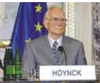
МИНИСТЕРСТВО ИНОСТРАННЫХ ДЕЛ АБСТРИХИОЛЦЕНЕР