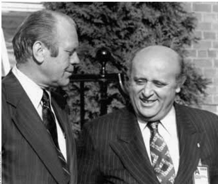
В дни Хельсинки: Сулейман Демирель обсуждает турецко-американские отношения с Джеральдом Фордом.

Встреча в Хельсинки была итогом Совещания по безопасности и сотрудничеству в Европе, сокращенно именовавшегося СБСЕ. Речь на нем шла об укреплении доверия и снижении напряженности по обе стороны «железного занавеса». Но главное оказалось в том, что согласованные там положения о правах человека стали исподволь подбадривать диссидентов в странах Восточной