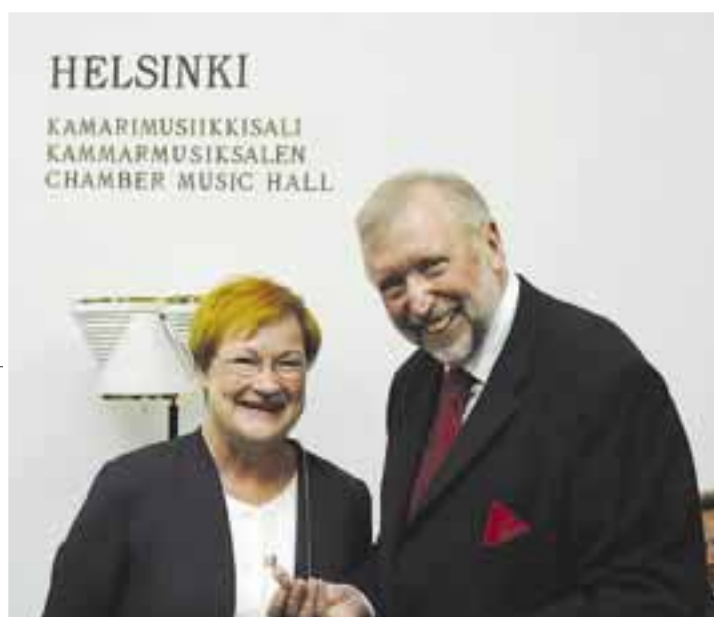
Президент Тарья Халонен и Действующий председатель Дмитрий Рупел во дворце «Финляндия».

Путь от Хельсинки до Хельсинки занял 30 лет. Но какой путь был проделан, что это было за время! Несмотря на все конфликты и трудности, и даже трагедии, в целом последние три десятилетия были отмечены позитивными переменами.