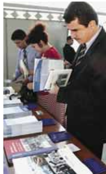
ЦЕНТР ОБСЕ В ДУШАНБЕ

Таджикистан подписал хельсинкский Заключительный акт 26 февраля 1992 года.