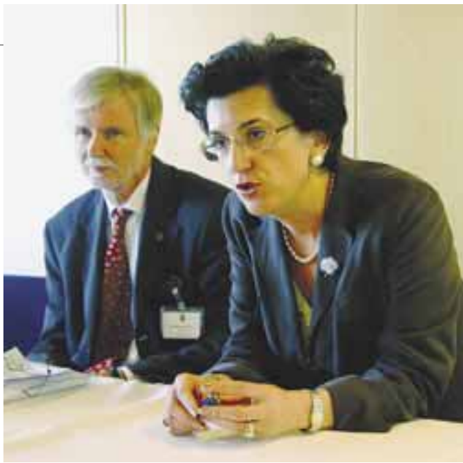
МИНИСТЕРСТВО ИНОСТРАННЫХ ДЕЛ ФИНЛЯНДИИ/ГРАФИК ХЕЙНОНЕН

Эрки Туомийа, министр иностранных дел Финляндии