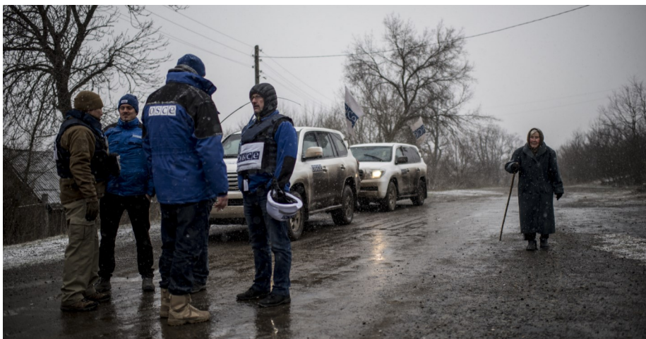
Спостерігачі СММ ОБСЄ під час патрулювання у Луганській області, березень 2016 р.