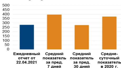
К-во зафиксированных нарушений режима прекращения огня 3