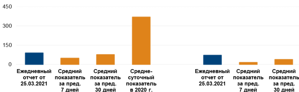
К-во зафиксированных взрывов 4