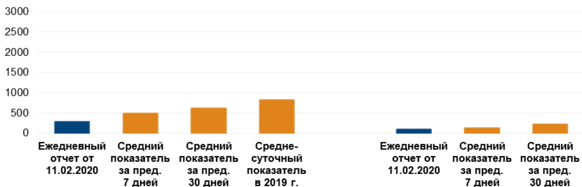
Количество зафиксированных взрывов 4