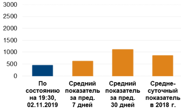
Количество зафиксированных нарушений режима прекращения огня 3