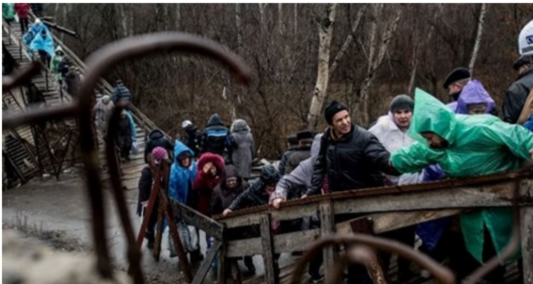
Гражданские лица пересекают разрушенный мост в Станице Луганской, Луганская область